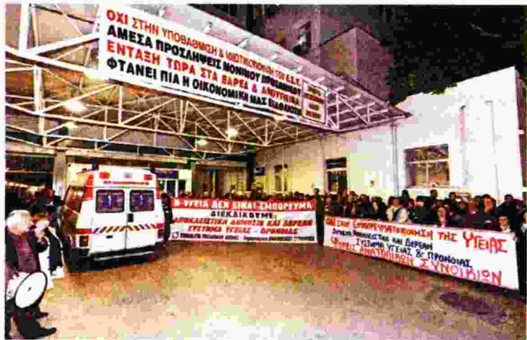
Από τη χτεσινή κινητοποίηση στο «Λαϊκό»

Ενδεικτικά, στο Παίδων «Αγία Σοφία» είναι κλειστή η Μονάδα Λοιμώξεων, στο «Λαϊκό» δεν γίνονται πλέον μεταμοσχεύσεις ήπατος και ο εξελιγμένος εξοπλισμός που υπάρχει δεν λειτουργεί λόγω έλλειψης προσωπικού. «Μ' αυτή την απαράδεκτη κατάσταση στις μονάδες Υγείας δεν συμβιβάζομαστε. Διεκδικούμε αποκλειστικά δημόσιο δωρεάν σύστημα Υγείας και Πρόνοιας, που να καλύπτει τις λαϊκές ανάγκες και να εξασφαλίζει μόνιμη σταθερή εργασία για τους υγειονομικούς. Κανένας να μη συμβιβαστεί με την απαράδεκτη κατάσταση στους