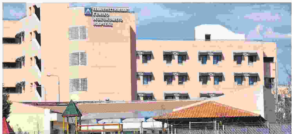
Θάλαμος αερίων τα εργαστήρια του Πανεπιστημιακού Νοσοκομείου Λάρισας, που βάζει σε κίνδυνο τη ζωή των εργαζομένων, καταγγέλλει η ΠΟΕΔΗΝ.

Σύμφωνα με την ΠΟΕΔΗΝ, μετά από λίγες ημέρες υπήρξαν ακόμη δύο