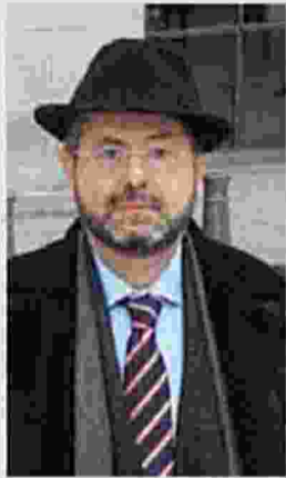
Στον Σαράκη η υπόθεση

Το σκάνδαλο της Novartis, το οποίο προσλαμβάνει πλέον απρόβλεπτες πολιτικές διαστάσεις, θα αρχίσει να ξετυλίγεται στη χώρα μας από την Εισαγγελία Διαφθοράς μετά την παρέμβαση της εισαγγελέως του Αρείου Πάγου Ξένης Δημητρίου, με εντολή του υπουργού Δικαιοσύνης, Σταύρου Κοντονή. Θεωρείται, όμως, απολύτως βέβαιο ότι σε σχέση με τα στοιχεία που υπάρχουν για τα πολιτικά πρόσωπα θα ενημερωθεί σε ανώτατο επίπεδο η κυβέρνηση από τους παράγοντες πέραν του Ατλαντικού, οι οποίοι ερευνούν την υπόθεση και θα παραδώσουν τον κατάλογο των πο-