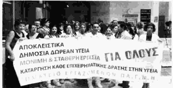
Σε αγώνα με όλο το λαό για αποκλειστικά δημόσια και δωρεάν Υγεία για όλους καλεί το Σωματείο Εργαζομένων στο ΠΑΓΝΗ

«Οι παρεμβάσεις αυτές», τονίζει το Σωματείο, «πατάνε αφενός στο έδαφος της συνειδητής απαξίωσης και της εγκληματικής αδιαφορίας και αφετέρου στην ευαισθησία του κόσμου για να καλύψει τα κενά στο χώρο της Υγείας, με απώτερο στόχο την απόσυρση του κράτους από την ευθύνη κατασκευής, αγοράς, συντήρησης, πρόσληψης προσωπικού στις δημόσιες δομές και το άνοιγμα του δρόμου