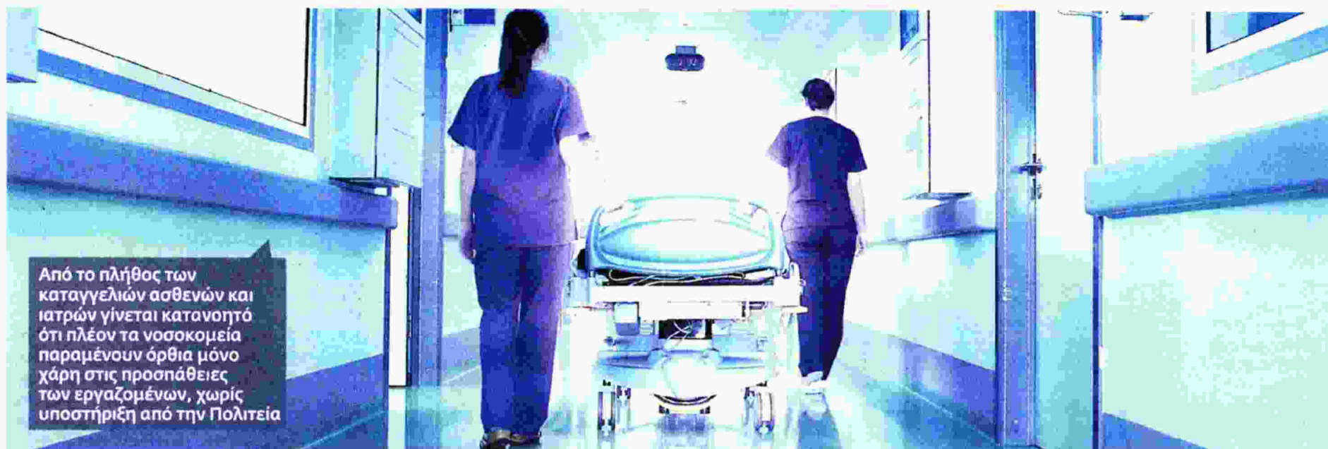
Από το πλήθος των καταγγελιών ασθενών και ιατρών γίνεται κατανοητό ότι πλέον τα νοσοκομεία παραμένουν όρθια μόνο χάρη στις προσπάθειες των εργαζομένων, χωρίς υποστήριξη από την Πολιτεία