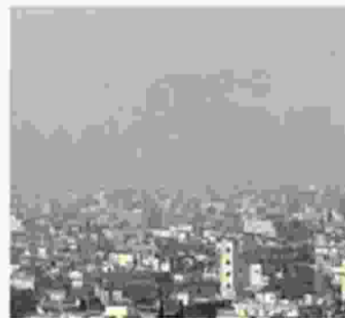
Το νέφος από αιωρούμενα σωματίδια έχει αυξηθεί τα τελευταία χρόνια στη Θεσσαλονίκη.

Σύμφωνα με μελέτη ερευνητών του Εργαστηρίου, που δημοσιεύτηκε στο επιστημονικό περιοδικό Science of the Total Environment, οι μεγάλες συγκεντρώσεις αερολυμάτων τους χειμερινούς μήνες, λόγω καύσης βιομάζας, προκαλούν περίπου 200