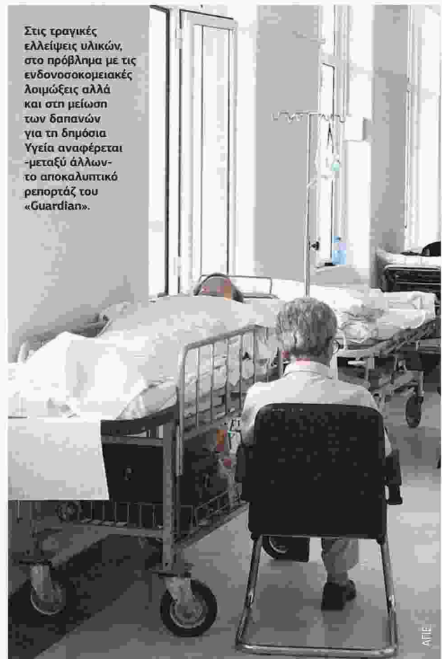
Στις τραγικές ελλείψεις υλικών, στο πρόβλημα με τις ενδονοσοκομειακές λοιμώξεις αλλά και στη μείωση των δαπανών για τη δημόσια Υγεία αναφέρεται -μεταξύ άλλων- το αποκαλυπτικό ρεπορτάζ του «Guardian».

Το ρεπορτάζ του «Guardian», πάντως, προκάλεσε μεγάλη αίσθηση -καθώς αναπαρήχθη από όλα τα διαδικτυακά μέσα ενημέρωσης- και πληθώρα αντιδράσεων από τα άλλα κόμματα. «Είναι φανερό πλέον ότι τα τεράστια προβλήματα της Υγείας στην Ελλάδα παίρνουν διεθνή δημοσιότητα κατατάσσοντας δυστυχώς τη χώρα μας σε τριτοκοσμικό επίπεδο κοινωνικών παροχών», τονίζει ο το-