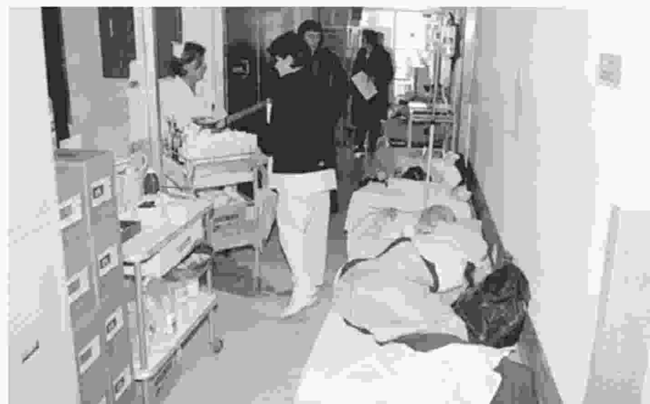
Νέο καμπανάκι από την ΠΟΕΔΗΝ για τα νοσοκομεία

«Η αναβολή των θεραπειών μπορεί να έχει δυσμενή επίπτωση στην αποτελεσματικότητά τους και σε κάθε περίπτωση συνιστά παραβίαση της ορθής επιστημονικής πρακτικής. Επίσης, βάζει σε μεγάλη ταλαιπωρία την ευαίσθητη ομάδα των ογκολογικών ασθενών, οι οποίοι σε πολλές περιπτώσεις έρχονται από την επαρχία για να κά-