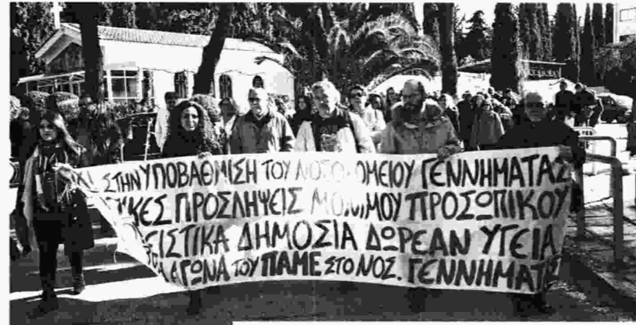
Η κινητοποίηση στο νοσοκομείο «Γεννηματάς»

Να σημειωθεί ότι μόνο στο νοσοκομείο «Γεννηματάς» οι κενές οργανικές θέσεις είναι πάνω από 360 και το επόμενο διάστημα θα αυξηθούν με τις συνταξιοδοτήσεις (μόνο τα δυο τελευταία χρόνια οι συνταξιοδοτήσεις των υγειονομικών ξεπερνούν τις 7.000). Στη Β' Παθολογική Κλινική, αντί για 24 νοσηλεύτριες υπάρχουν μόνο οκτώ που καλούνται να μεριμνούν για 30 - 35 κρεβάτια καθημερινά. Στο Τμήμα Επειγόντων Περιστατικών (ΤΕΠ) οι νοσηλεύτριες δεν μπορούν να πάρουν ούτε την άδειά τους κι όταν βγαίνουν