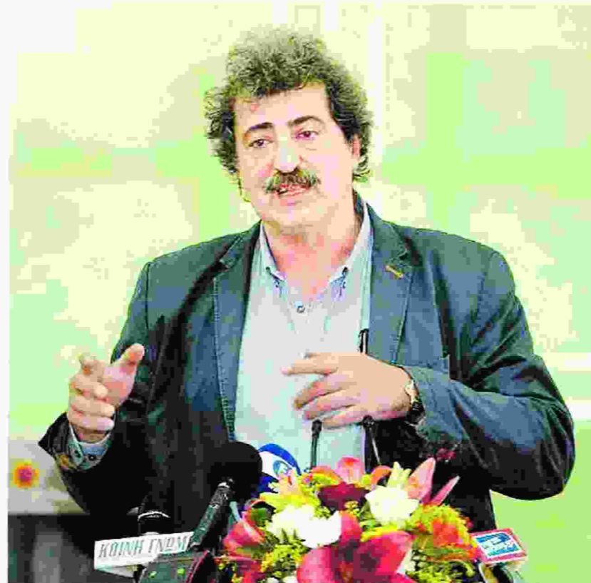
Σύμφωνα με τον κ. Πολάκη, ενώ το 2015 τα νοσοκομεία έκλεισαν με χρέος 935 εκατομμύρια ευρώ, το 2016 έκλεισαν με 35 εκατομμύρια πλεόνασμα, έχοντας ξεπληρώσει τις υποχρεώσεις που κληρονόμησαν από τους προηγούμενους, και μάλιστα τα 110 από τα 140 νοσοκομεία της χώρας, χωρίς να δημιουργήσουν νέα ληξιπρόθεσμα με τη νομιμοποίηση δαπανών που είχαν κάνει μέχρι τις 31 Δεκεμβρίου.

Ο αναπληρωτής υπουργός εμφανίστηκε αισιόδοξος ότι η Ελλάδα θα βγει από το μνημόνιο τον Ιούνιο του 2018. Επιπλέον ανέφερε ότι στον ενάμιση χρόνο της θητείας της ηγεσίας του υπουργείου Υγείας κατάφερε να εξισορροπήσει το σύστημα παρά τα οργανωμένα, όπως είπε, συμφέροντα, τα μνημόνια, τους δανειστές, τους εκβιαστές αλλά και τις δικές της ανεπάρκειες. Επισήμανε ότι από τον Ιανουάριο του 2015 αυξήθηκαν κατά 300 εκατομμύρια τα κονδύλια από