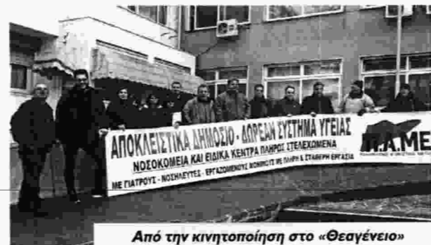
Από την κινητοποίηση στο «Θεαγένειο»

Κατά τη διάρκεια της παρέμβασης στην υποδιοικήτρια της 7ης ΥΠΕ, αναδείχτηκαν οι διαχρονικές ευθύνες για την υποστελέχωση και υποχρηματοδότηση των νοσοκομείων, ενώ τονίστηκε το σοβαρό ζήτημα με τις ευέλικτες εργασιακές σχέσεις που αφορά στο επικουρικό προσωπικό, στους εργαζόμενους της Παιδοψυχιατρικής, που οι συμβάσεις τους τελειώνουν το Σεπτέμβρη του 2017. Συνολικά μόνο για το ΠαΓΝΗ 180 εργαζόμενοι απολύονται μέχρι τέλος του 2017. Για το συγκεκριμένο ζήτημα το Σωματείο δεν πήρε απάντηση.