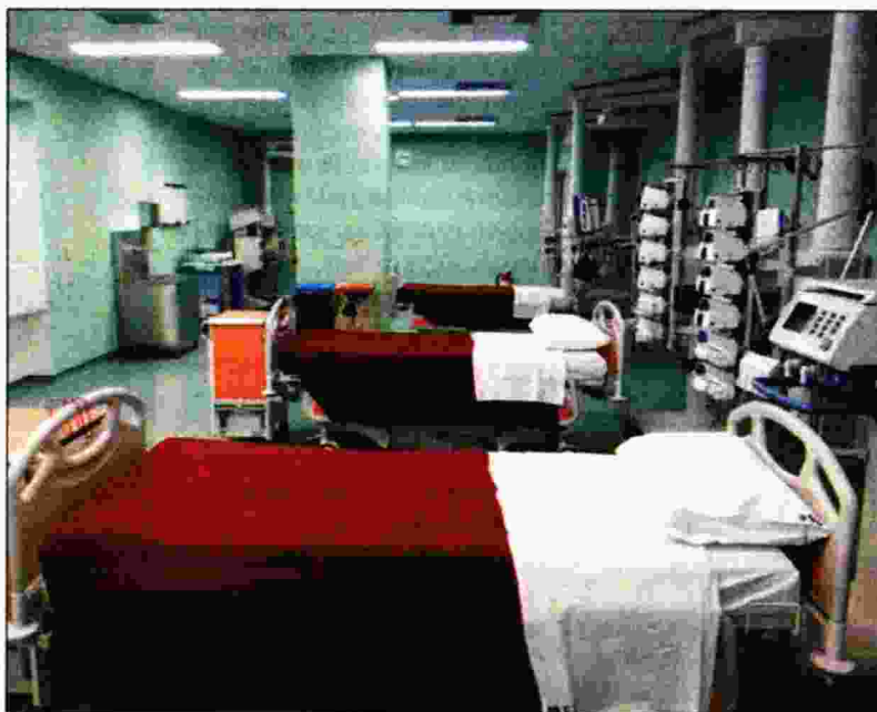
Η Μονάδα Εντατικής Θεραπείας του Νοσοκομείου Κατερίνης