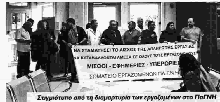
Στιγμιότυπο από τη διαμαρτυρία των εργαζομένων στο ΠαΓΝΗ