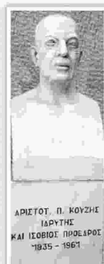
Η είσοδος του Νοσοκομείου «Αγιος Σάββας» και η προτομή του Αριστοτέλη Κούζη

τος». Επρόκειτο περί της πρώτης οργανωμένης εκστρατείας εναντίον της ασθένειας, με πλήθος πληροφοριών και στατιστικών στοιχείων για την κατάσταση που επικρατούσε στην Ελλάδα και τις ελλείψεις που υπήρχαν.