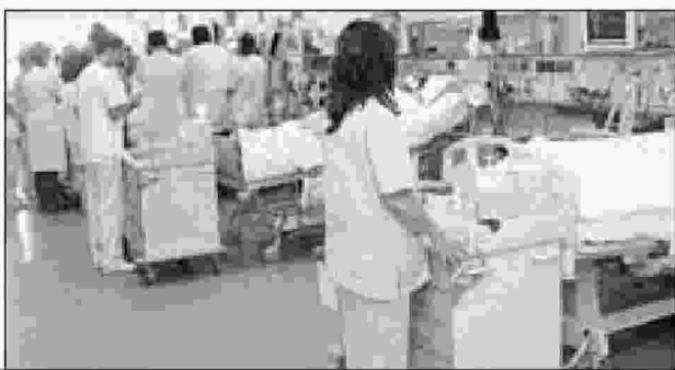
Οι αιτήσεις αφορούν σε 1.666 θέσεις σε φορείς υγείας

Συνεπώς, εκτιμάται ότι θα υπάρξει υπεράριθμο προσωπικό και στις τρεις υπηρεσίες με κίνδυνο διαθεσιμότητας, υποχρεωτικών μετατάξεων του προσωπικού και ιδιωτικοποίηση των εν λόγω υπηρεσιών.