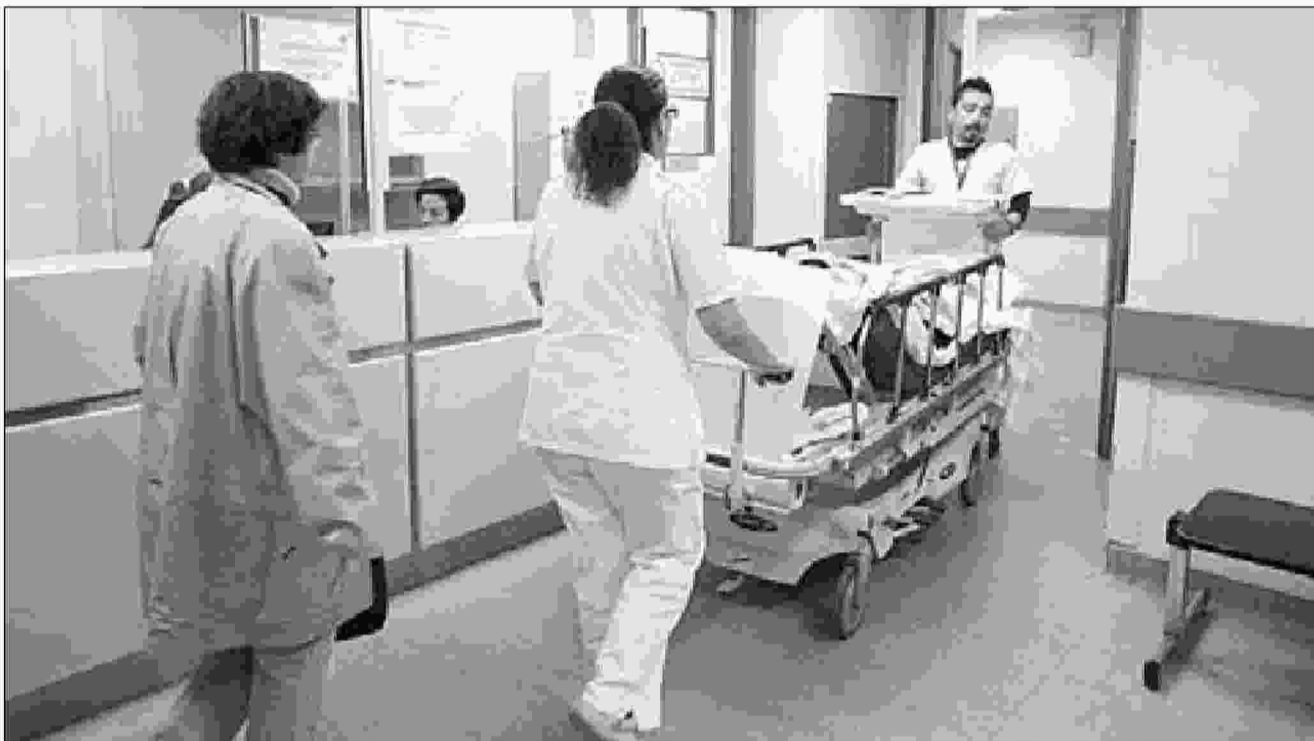
Σημαντικές αλλαγές φέρνει το σχέδιο νόμου του Υπουργείου Υγείας για την αναμόρφωση των νοσοκομείων

Η ΠΟΕΔΗΝ θεωρεί ότι μέσα από την συγκεκριμένη πρόταση επιχειρείται ανασχεδιασμός του υγειονομικού χάρτη, αλλά συγκαλυμμένα και με τρόπο που αποσκοπεί στην ουσιαστική κατάργηση νοσοκομείων,