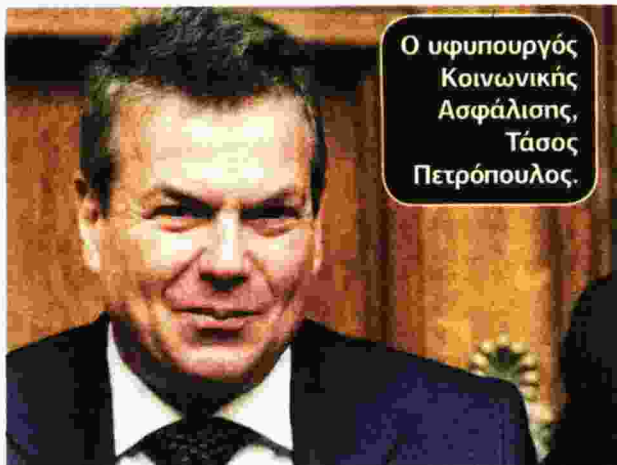
Ο υφυπουργός Κοινωνικής Ασφάλισης, Τάσος Πετρόπουλος.