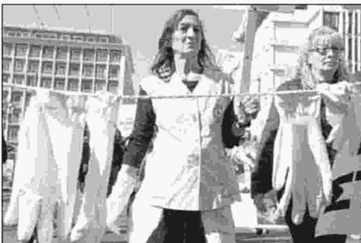
■ Δεκάδες καθαρίστριες στά νοσοκομεία διαδήλωσαν χθές στήν Ἀθήνα

ΕΠΟΧΕΣ πρό τῶν μνημονίων θύμιζε χθές τό Κέντρο τῶν Ἀθηνῶν, λόγω τῶν διαδηλώσεων διαφόρων ἐπαγγελματικῶν φορέων. Αὐτό πού προκάλεσε αἰσθησιή ἦταν ἡ συγκέντρωσις – γιά πρώτη φορά – τῶν Μανιατῶν μπροστά στήν Βουλή, οἱ ὁποῖοι διεμαρτύροντο γιά τοῦς νέους δασικούς χάρτες. Τό παράδειγμά τους ἀκολούθησαν οἱ πυροσβέστες πενταετούς θητείας, οἱ ἰατροί, ἐργαζόμενοι στά ἀσφαλιστικά Ταμεία, καί οἱ ἀποκαλούμενοι ἐργολάβικοι ἐργαζόμενοι στά νοσοκομεία, ὡς καί οἱ ὑπάλληλοι τῆς Ἐθνικῆς Ἀσφαλιστικῆς. Οἱ περισσότερες συγκεντρώσεις ἐνώθησαν στήν Πλατεία Συντάγματος, προκαλώντας γιά δεύτερη συνεχῆ ἡμέρα κυκλοφοριακό χάος στό κέντρο τῶν Ἀθηνῶν. Ἀνάλογη θά εἶναι καί ἡ σημερινή εἰκόνα, ἀφοῦ τά μέσα σταθερῆς τροχιάς (Μετρό, ΗΣΑΠ, Τράμ) θά μείνουν ἀκίνητοποιημένα, ταλαιπωρώντας χιλιάδες ἀπελπισμένους πολίτες καί προκαλώντας μεγάλες ζημιές στήν ἐμπορικῆ κίνησι τῆς περιοχῆς. Ὁ Ἐμπορικὸς Σύλλογος Ἀθηνῶν κάλεσε τοῦς ἐργαζόμενους τῆς ΣΤΑΣΥ νά ἀκολουθήσουν ἄλλες μορφές κινητοποιήσεων». Τήν πάγια θέση τῆς ΝΔ κατὰ τῶν ἀπεργιακῶν κινητοποιήσεων, πού ἔχουν ὡς τελικό ἀποτέλεσμα τήν ταλαιπωρία τῶν πολιτῶν, σημείωσε ὁ τομάρχης Μεταφορῶν, Κ. Καραμανλῆς. Ἐξήγησε πῶς, ἀκόμη καί ἐάν ἔχουν δίκαιο οἱ ἐργαζόμενοι τῆς ΣΤΑΣΥ, δέν μποροῦν νά ἀποτελοῦν ἐξαίρεση.