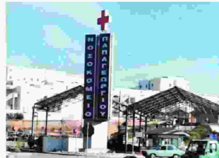
Σύμφωνα με το σωματείο εργαζομένων του "Παπαγεωργίου" οι παραπάνω αποφάσεις, οι οποίες μπορεί να κλιμακωθούν τον επόμενο μήνα, ελήφθησαν μετά την άρνηση του υπουργείου Υγείας να δώσει λύσεις στα προβλήματα έλλειψης προσωπικού.

Συνεπώς το δ.σ. του σωματείου εργαζομένων αποφάσισε ομόφωνα να προχωρήσει στις παρακάτω ενέργειες: παρά-