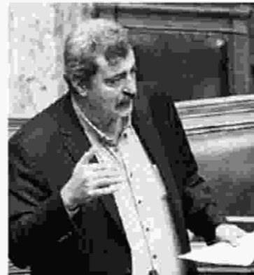
Ο αναπληρωτής υπουργός Υγείας Παύλος Πολάκης επιβεβαίωσε, χθες στη Βουλή, το δημοσίευμα της «Αυγής» στις 8 Φεβρουαρίου, λέγοντας ότι το έγγραφο με τους 23 διορισμούς δεν έχει υπογραφή Γεωργιάδη, αλλά δίπλα στα ονόματα των διορισθέντων υπάρχει το όνομα Θεοδωράκος (πρόκειται για συνεργάτη του Άδ. Γεωργιάδη), το όνομα Γεωργιάδης και σε ένα το όνομα της συζύγου του Ευγ. Μανωλίδου

«Το θεωρείτε ηθικό εσείς να είστε υπουργός και ιδιοκτήτης μίας ΕΠΕ που την έχετε μαζί με έναν συνεταιίρο και ο συνεταιίρος να παίρνει 100.000 ευρώ τη χρονιά που ήσασταν υπουργός;» ρώτησε ο υπουργός.