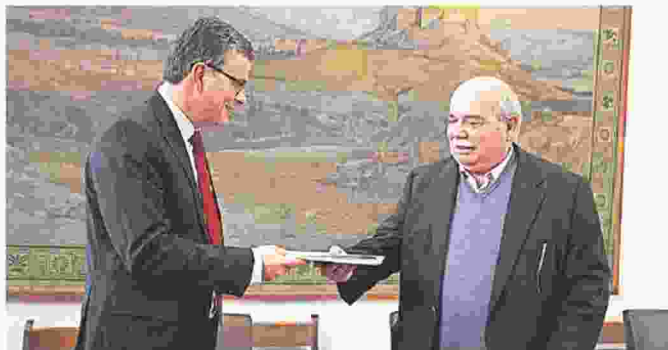
>> Ο Συνήγορος του Πολίτη, Ανδρέας Ποττάκης κατά την παράδοση χθες της έκθεσης στον πρόεδρο της Βουλής, Νίκο Βούτση

Χ αρακτηριστικά ανθρωπιστικής κρίσης έχει λάβει η οικονομική δυσπραγία μετά από οκτώ, πλέον, συναπτά έτη ύφεσης, με όλο και περισσότερες ομάδες ανθρώπων να δυσκολεύονται να ανταποκριθούν στις βασικότερες των αναγκών και των υποχρεώσεών τους. Σύμφωνα με την έκθεση του Συνήγορου του Πολίτη για το 2016, οι ευάλωτες ομάδες στη χώρα μας διευρύνονται συνεχώς, αφού σε αυτές δεν περιλαμβάνονται μόνο τα άτομα με ειδικές ανάγκες ή οι άνεργοι, αλλά και μεγάλο πλήθος πολιτών οι οποίοι μέχρι πρόσφατα θα μπορούσαν να διατηρήσουν ένα βιολογικό επίπεδο σχετικής αξιοπρέπειας. Μπροστά σε αυτή την κατάσταση, η «δυσκίνητη» ελληνική διοίκηση αδυνατεί να δείξει το ανθρωπινό πρόσωπό της, με τα περισσότερα προβλήματα των πολιτών να εντοπίζονται στις υπηρεσίες κοινωνικής ασφάλισης, υγείας - πρόνοιας, κοινωνικής ωφελείας, αλλά και τις φορολογικές αρχές, που συχνά καθυστερούν να αποφανθούν για υποβαλλόμενα αιτήματα. «Ο Συνή-