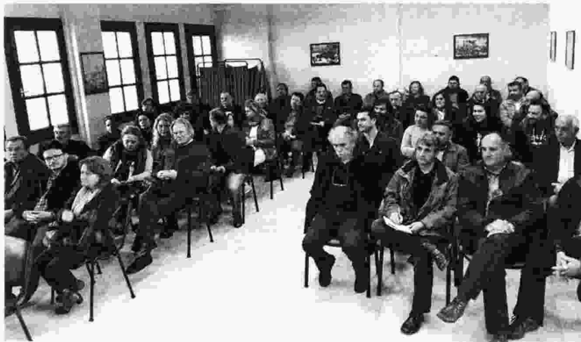
Από τη σύσκεψη που πραγματοποιήθηκε στην αίθουσα του Εργατικού Κέντρου Πρέβεζας

Παρουσιάζοντας την τραγική εικόνα που επικρατεί στην περιοχή, ως αποτέλεσμα της αναδιάρθρωσης, σημείωσε ότι τα Κέντρα Υγείας, τα οποία αν και παίζουν σπουδαίο ρόλο τόσο στην πρωτοβάθμια περίθαλψη όσο και στην αντιμετώπιση επειγόντων περιστατικών, συστηματικά υποβαθμίζονται, φτάνο-