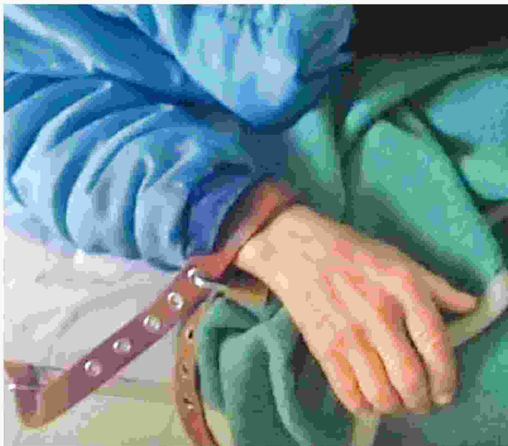
ΟΙ ΤΡΑΓΙΚΕΣ ελλείψεις σε προσωπικό έχουν ως αποτέλεσμα την καθήλωση του 60%-80% των ασθενών