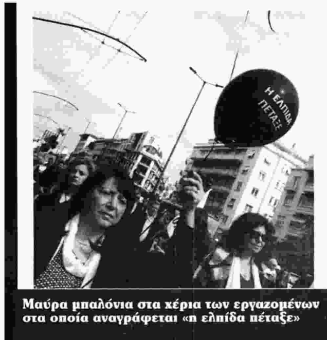
Μαύρα μπαλόνια στα χέρια των εργαζομένων στα οποία αναγράφεται «η ελπίδα πέταξε»