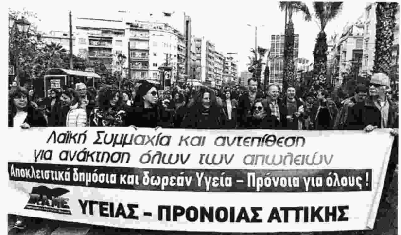
Την πάλη για αποκλειστικά δημόσια και δωρεάν Υγεία για όλους προτάσσουν οι δυνάμεις που συσπειρώνονται στο ΠΑΜΕ

Με τα πανό των σωματείων τους, διαδήλωσαν ενάντια στην εμπορευματοποίηση της Υγείας και απαιτήσαν προσλήψεις μόνιμου προσω-