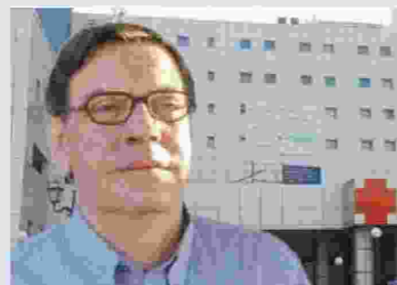
Μ. Δραμητινός: Σε άμορα νοσοκομεία τα νέα περιστατικά νεοπλασιών

Επισημαίνεται ότι δεν διακόπεται καμία από τις τρέχουσες θεραπείες και η λειτουργία της Μονάδας συνεχίζεται μέσα στα πλαίσια του υφιστάμενου προϋπολογισμού, χωρίς να διαταράσσεται η εύρυθμη λειτουργία των Τμημάτων Ισομερώς».