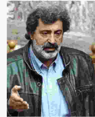
«Πόλεμος» ανακοινώσεων μετά την απάντηση Πολάκη για το θέμα των καρκινοπαθών στο Νοσοκομείο Βόλου

Το να καταλογίζεις τις ευθύνες αλλού και όχι στις εγκλημα-