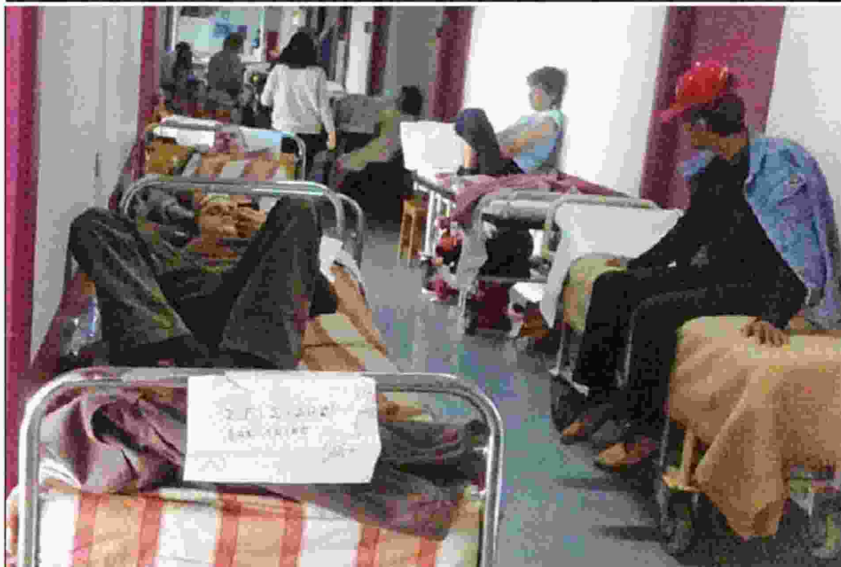
Ράντζα στους διαδρόμους της Ψυχιατρικής Κλινικής του Ευαγγελισμού

ΤΗΝ «κόλαση» που βιώνουν οι ασθενείς και οι εργαζόμενοι στην Ψυχιατρική Κλινική του Νοσοκομείου Ευαγγελισμού αποτυπώνουν οι φωτογραφίες που έδωσε στη δημοσιότητα η Πανελλήνια Ομοσπονδία Εργαζομένων Δημόσιων Νοσοκομείων (ΠΟΕΔΗΝ).