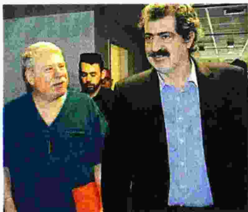
Από την επίσκεψη του Παύλου Πολάκη στο Νοσοκομείο Ζακύνθου

Μία εβδομάδα μετά την εντολή Πολάκη να ανοίξουν τα χειρουργεία στο Νοσοκομείο Ζακύνθου, αδιαφορώντας για τις αντίθετες επιστημονικές εισηγήσεις των φορέων, δυστυχώς επιβεβαιώνονται οι χειρότεροι φόβοι της ΠΟΕΔΗΝ, μέλη της οποίας με αλληπάλληλες προειδοποιήσεις κατήγγειλαν σε κάθε τόνο ότι είναι επικίνδυνα.