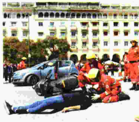
ΣΤΙΓΜΙΟΤΥΠΟ από την άσκηση των εθελοντών του ΕΕΣ στην πλατεία Αριστοτέλους στη Θεσσαλονίκη

Παράλληλα, σε ειδικά διαμορφωμένα περίπτερα πραγματοποιήθηκαν παρουσιάσεις Α' Βοηθειών για την Καρδιοαναπνευστική Αναζωογόνηση, την αντιμετώπιση αιμορραγιών και μυοσκελετικών κακώσεων σε ενήλικες, παιδιά και βρέφη.