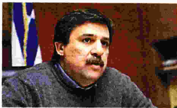
Ο υπουργός Υγείας Ανδρέας Ξανθός

Ο κ. Ξανθός σε δηλώσεις του επισήμανε ότι για πρώτη φορά γίνεται δημόσια συζήτηση σε μια διαχρονική παθογένεια του συστήματος υγείας. «Πρέπει να εξετάσουμε τις αιτίες. Οι παθογένειες του συστήματος και οι καθυστερή-