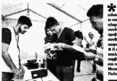
Το δημοσίευμα της «Εφ.Συν.» στις 5/4/2017

ΑΜΕΣΗ ΚΑΤΑΘΕΤΗ των δεδομένων και διασφάλιση της ομαλής καταβολής της μισθοδοσίας διεκδικούν οι συμβασιούχοι της Υπηρεσίας Αιολίου, που συνεχίζουν σήμερα τη 48ωρη απεργία που κηρύχθηκε από το Δ.Σ. του νοσοκομείου, ενώ σε στάση εργασίας προχωρούν σήμερα οι συμβασιούχοι του κοινωνικού φαρμακείου του ΟΑΕΔ που εργάζονται στα Κέντρα Υγείας και Ταυτοποίησης (ΚΥΤ) της Χίου (9 η.μ.-2 μ.μ. και 2-5 μ.μ.) και της Σάμου (10 η.μ.-1 μ.μ.), διεκδικώντας να ανανεωθούν οι συμβάσεις τους.