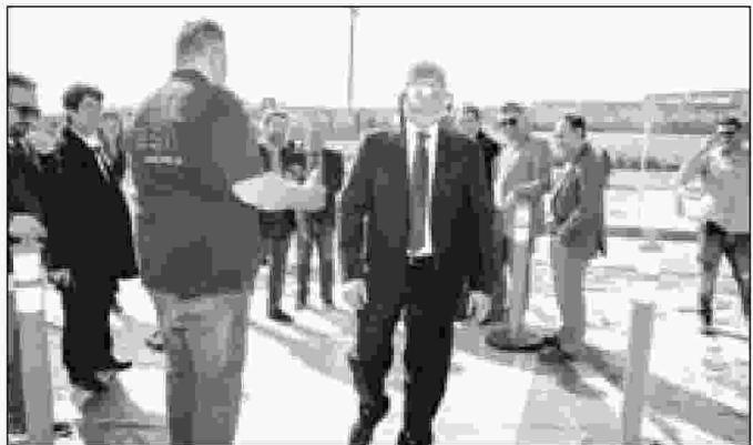
Εντυπωσιακό είναι το πάρκο κυκλοφοριακής αγωγής

Στην πρώτη ημέρα των εκδηλώσεων στο πάρκο συμμετείχε το Ινστιτούτο Οδικής Ασφαλείας «Πάνος Μυλωνάς» και στη δεύτερη, την Παρασκευή 7 Απριλίου, θα έρθει για πρώτη φορά στο Ηράκλειο το «Λούνα Παρκ Ανακύκλωσης» της Εταιρείας Αξιοποίησης Ανακύκλωσης. Παράλληλα λαμβάνουν μέρος με ενδιαφέρουσες δράσεις φορείς όπως η Τροχαία Ηρακλείου, η Δημοτική Αστυνομία, η Πυροσβεστική Υπηρεσία, το Ε.Κ.Α.Β. Κρήτης, το Περιφερειακό Τμήμα του Ελληνικού Ερυθρού Σταυρού Ηρακλείου, ο Σύλλογος ΑΜΕΑ Ηρακλείου, το Σωματείο Εκπαιδευτών Οδήγησης και Κυκλοφοριακής Αγωγής Ηρακλείου, μέλη του εργαστηρίου μελέτης συμπεριφορών υγείας & οδικής ασφάλειας του ΤΕΙ Κρήτης κ.α