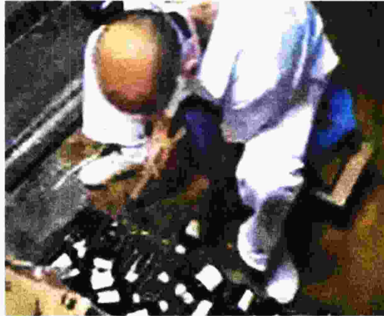
Ντυμένος με τα λευκά του νοσοκομείου και με σφυρί στο χέρι, εργαζόμενος σπάει μπουκάλια φαρμάκων και αδειάζει το περιεχόμενο στον υπόνομο

Μετά όμως ήρθε η κρίση και άρχισαν τα προβλήματα που κατά κύριο λόγο πλήρωσαν και εξακολουθούν να πληρώνουν οι εργαζόμενοι. Η μισθοδοσία καθυστερεί να τους καταβληθεί για μήνες, νέες προσλήψεις δεν γίνονται και από τα 160 άτομα που εργάζονταν στο θεραπευτήριο σήμερα έχουν απομείνει 120. Ωστόσο, το σημαντικότερο πρόβλημα που αντιμετωπίζει το «Ευγενίδειο» είναι η διαχείριση των οικονομικών του και το πλήθος καταγγελιών που τη συνοδεύουν. Πριν από περίπου έναν χρόνο, ο αρμόδιος υπουργός, Δημήτρης Παπαγελοπούλου, απαντώντας σε ερώτηση