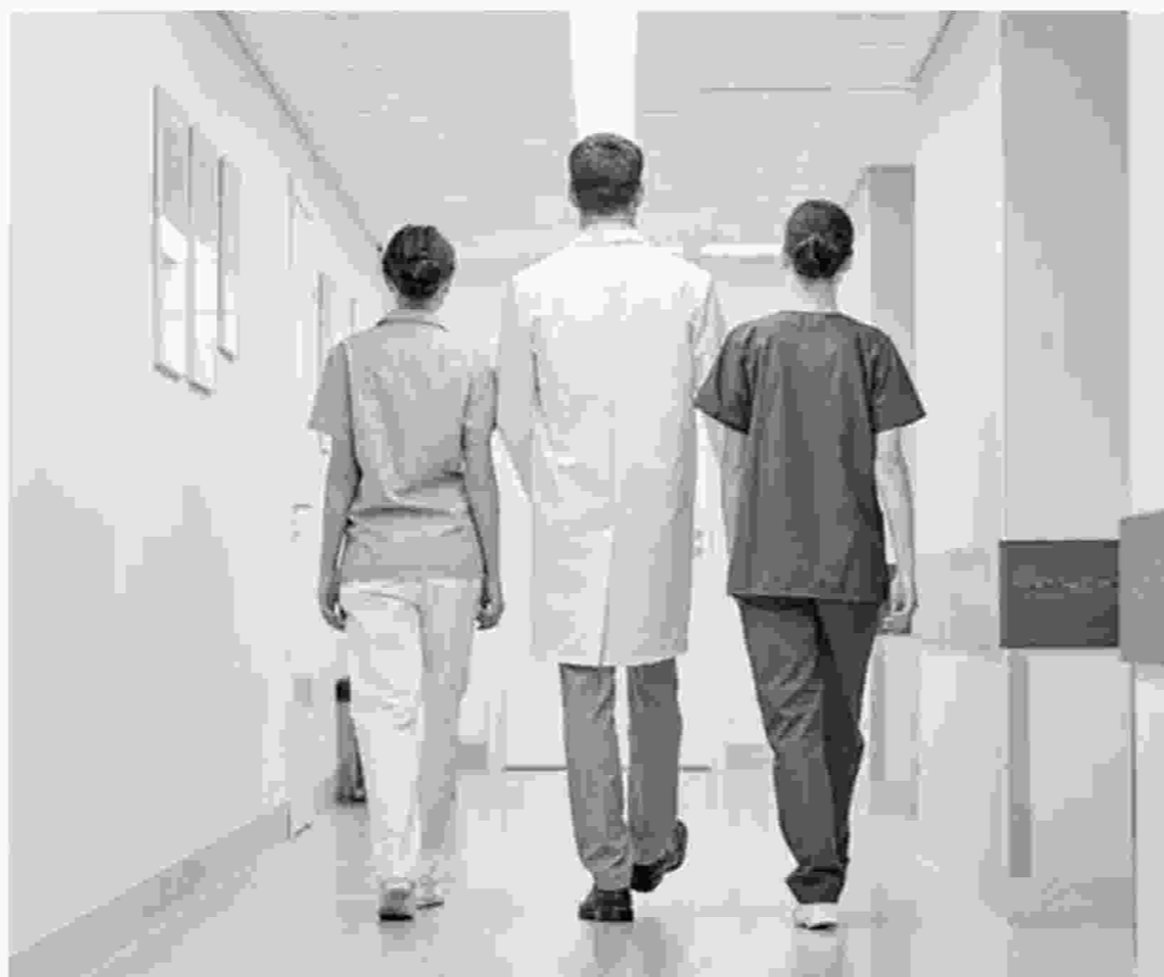
Για «εγκλήματα διαχειριστικής ανεπάρκειας του ΕΚΑΒ» κάνει λόγο η ΠΟΕΔΗΝ.

σε όλη την Χαλκιδική. Δεν μπορούν να καλύψουν τις ανάγκες σε διακομιδές. Κινδυνεύουν κατ' εξακολούθηση σοβαρά έκτακτα περιστατικά. Οι διακομιδές γίνονται με ιδιωτικά μέσα" αναφέρει η ΠΟΕΔΗΝ .