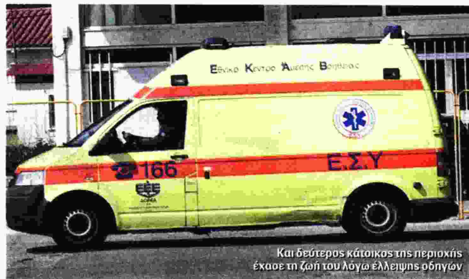
Και δεύτερος κάτοικος της περιοχής έχασε τη ζωή του λόγω έλλειψης οδηγών

Οι μεγάλες καθυστερήσεις που σημειώνονται κατά τη διακομιδή, λόγω ελλείψεων