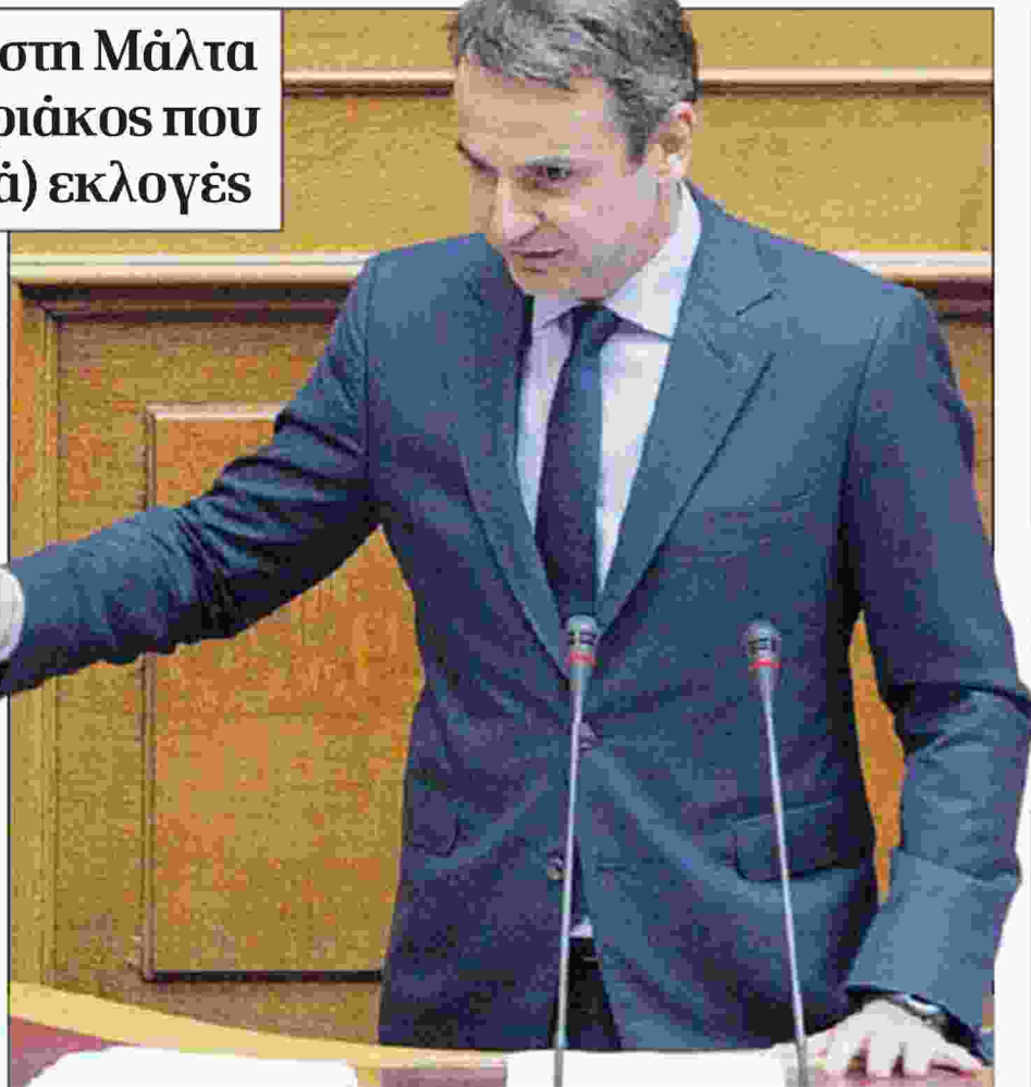
Ο Κυριάκος Μητσοιάκης χθες στο βήμα της Βουλής

Ο πρόεδρος της Ν.Δ. αποδόμησε την προπαγανδιστική τακτική του Μαξίμου σε σχέση με τη πρόσφατη συμφωνία της Μάλτας: «Η συμφωνία, εκτός από άτακτη υποχώρηση, συνιστά το βατερλό μιας θλιβερής διακυβέρνησης. Η κυβέρνηση προσπαθεί να εμφανίσει τη