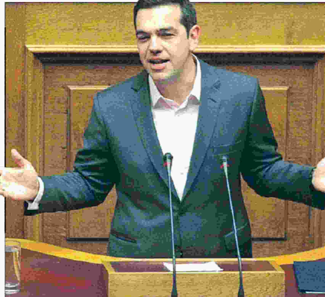
Ο Αλέξης Τσίπρας χθες στη συζήτηση για σύσταση εξεταστικής επιτροπής για την Υγεία

«Η αξιολόγηση κλείνει με συνολική συμφωνία αλλά και με μηδενικό δημοσιονομικό κόστος» τόνισε στην αρχή της ομιλίας του ο Αλέξης Τσίπρας, ο οποίος σήμερα στις 9.00 το πρωί συγκαλεί το υπουργικό συμβούλιο για να ενημερώσει αναλυτικά για τη συμφωνία. Εξαπολύοντας, δε, προσωπική επίθεση στον Κυριάκο Μητσοτάκη, ο πρωθυπουργός υπογράμμισε ότι «κατανόω το vertigo που βρίσκεται η αντιπολίτευση μετά τη Μάλτα, θα είμαι επιεικής με τον Κυριάκο Μητσοτάκη, ο οποίος δεν βρίσκεται στη Βουλή αυτή τη στιγμή». Εξάλλου ανέφερε ότι «ο κ. Μητσοτάκης φέρεται σαν