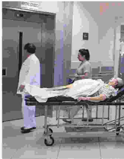
Επί των ημερών ΣΥΡΙΖΑ - ΑΝΕΛ το προσωπικό των νοσοκομείων μειώθηκε κατά 7.500 μόνιμους υπαλλήλους.

ΑΠΟΔΕΚΑΤΙΣΜΕΝΟ και πολύ κουρασμένο είναι το νοσηλευτικό προσωπικό στα νοσοκομεία της χώρας μας. Τα αποτελέσματα εκτενούς έρευνας που πραγματοποίησε η Πανελλήνια Ομοσπονδία Εργαζομένων Δημόσιων Νοσοκομείων (ΠΟΕΔΗΝ) δείχνουν ότι οι ελλείψεις σε νοσηλευτές έχουν «βαρέσει κόκκινο».