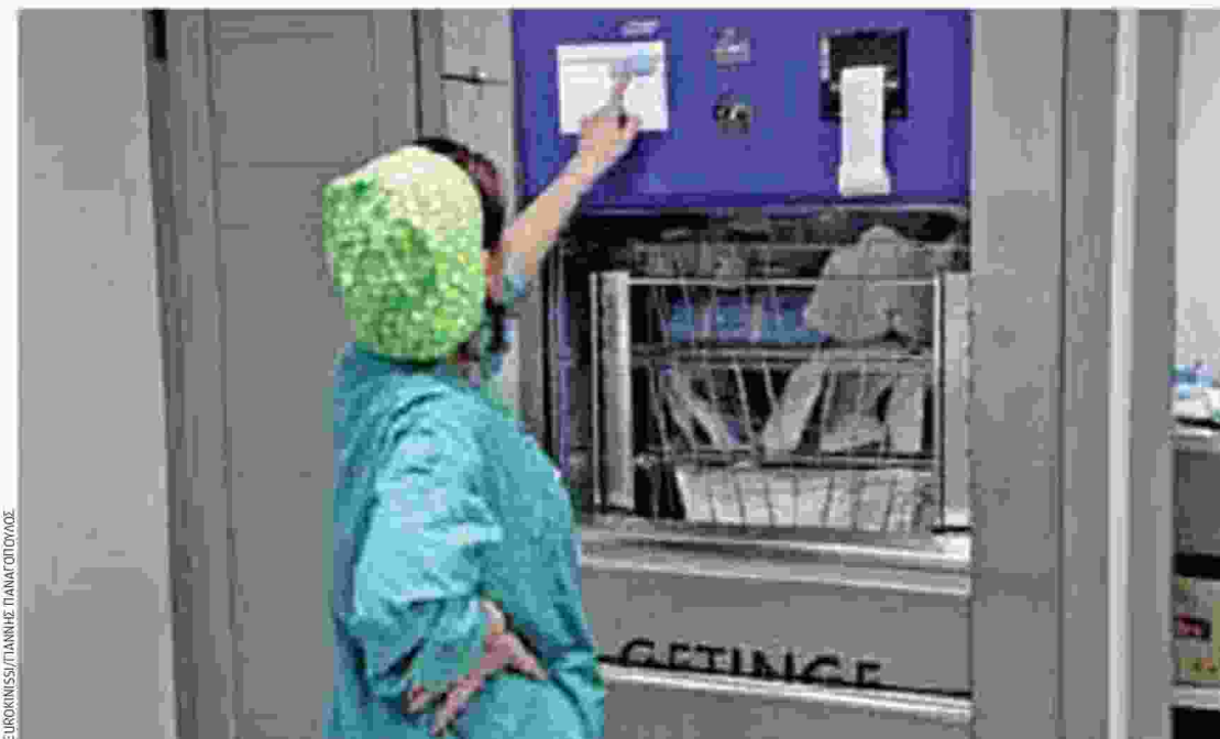
Ενας νοσηλευτής συνήθως αντιστοιχεί σε 40 ασθενείς. Ταυτόχρονα, 1.500 νοσηλευτές είναι αποσπασμένοι σε άλλες υπηρεσίες και σε γραφεία βουλευτών...

Το προσωπικό βρίσκεται σε συνθήκες εργασιακής εξουθένωσης, αφού λόγω των μεγάλων ελλείψεων δεν τηρείται το θεσμικό πλαίσιο για το ωράριο που ορίζει δύο ρεπό την εβδομάδα, μία νυκτερινή βάρδια την εβδομάδα, 12ωρη ανάπαυση μεταξύ δύο βαρδιών και κορήγηση κανονικής άδειας 25-30 ημερών κατ' έτος. «Εργάζονται πολλές φορές ένα μήνα σερί χωρίς ρεπό, ειδικά το καλοκαίρι και τις εορτές για να δοθεί άδεια ή ρεπό σε ελάχιστους