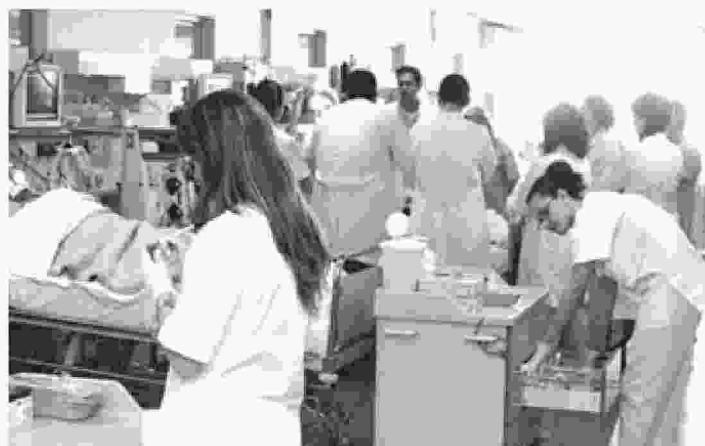
Η έρευνα της Πανελλήνιας Ομοσπονδίας Εργαζομένων στα δημόσια νοσοκομεία, καταγράφει τα σοβαρά προβλήματα υποστελέχωσης

Η ΠΟΕΔΗΝ αναφέρει ότι το νοσηλευτικό προσωπικό εργάζεται χωρίς να υπάρχει καθηκοντολόγιο και δεν τηρούνται τα επαγγελματικά δικαιώματα. Επισημαίνει