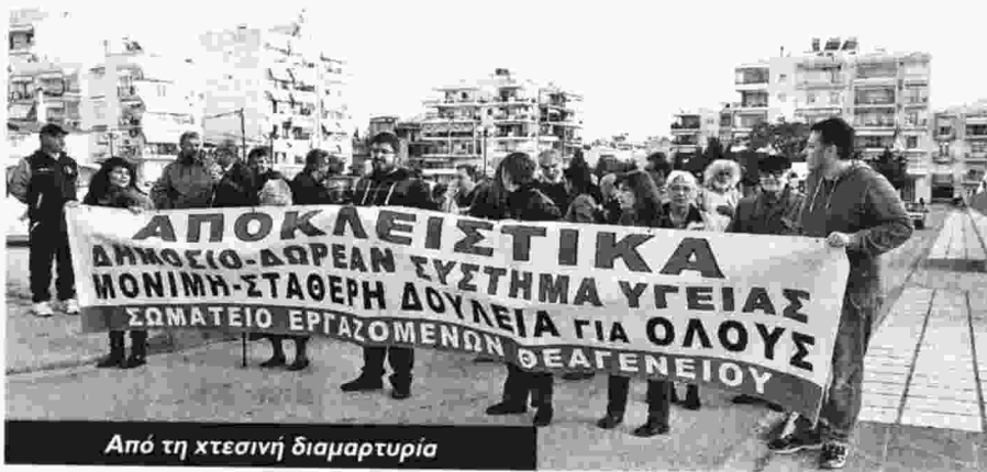
Από τη χτεςινή διαμαρτυρία

Κάλεσε τέλος υγειονομικούς και όλο τον λαό να δυναμώσουν