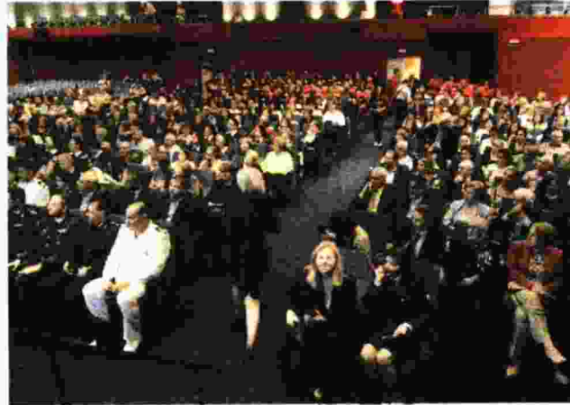
Πανοραμική άποψη από την κατάμεστη αίθουσα όπου πραγματοποιήθηκε η εκδήλωση του ΕΕΣ. Αύριο πλήρες φωτορεπορτάζ

ΕΠΑΙΝΟΣ Άσυλο Χρόνιων Παθήσεων Παιδων «Κιβωτός Αγάπης»- Κατερί-