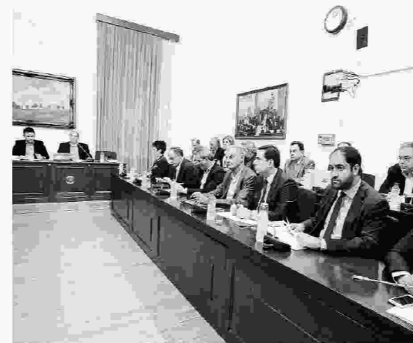
Στην ανάγκη να χυθεί άπλετο φως αλλά και να αποφευχθούν οι κομματικές σκοπιμότητες συμφώνησαν τα μέλη της εξεταστικής επιτροπής για τα σκάνδαλα στο χώρο της Υγείας.