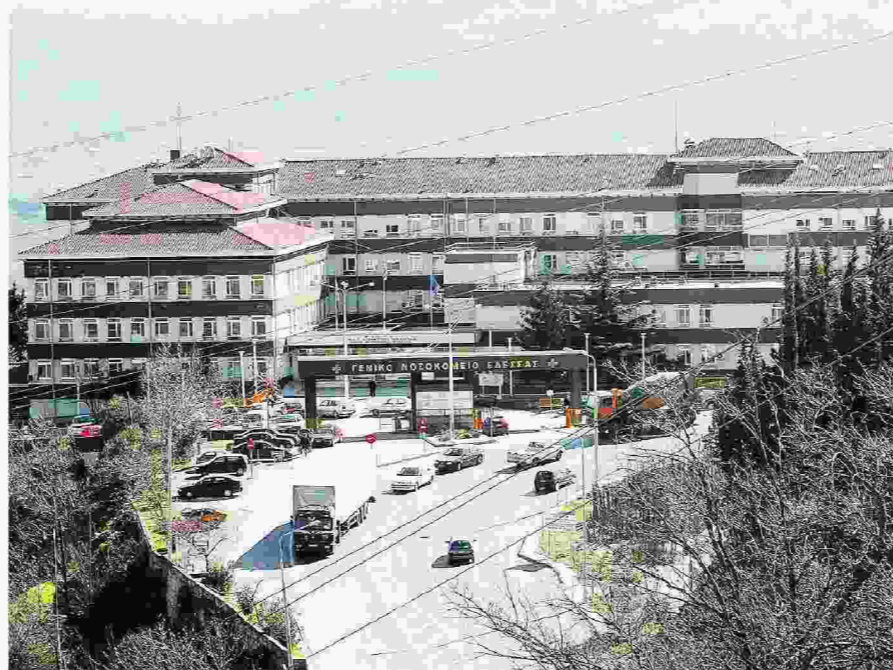
Οι προμήθειες της ορθοπεδικής κλινικής του Νοσοκομείου Έδεσσας έχουν εξελιχθεί σε γεφύρι της Άρτας, καθώς από το 2006 ερευνάται σκάνδαλο, με το οποίο ζημιώθηκε το δημόσιο με ποσό ύψους 2 εκατομμυρίων ευρώ.

Η υπόθεση, που εξετάστηκε χθες από το πενταμελές εφετείο Θεσσαλονίκης, αφορούσε το αδίκημα της παράβασης καθήκοντος και της έγκρισης δαπανών για προμήθεια ορθοπεδικών υλικών ανά ασθενή σύμφωνα με το κατηγορητήριο. Μετά την αθώωση των περισσότερων κατηγορούμενων στον πρώτο βαθμό χθες στο εδώλιο κάθισαν η τότε επικεφαλής του τμήματος προμηθειών του νοσοκομείου και ένας γιατρός, που το 2010,