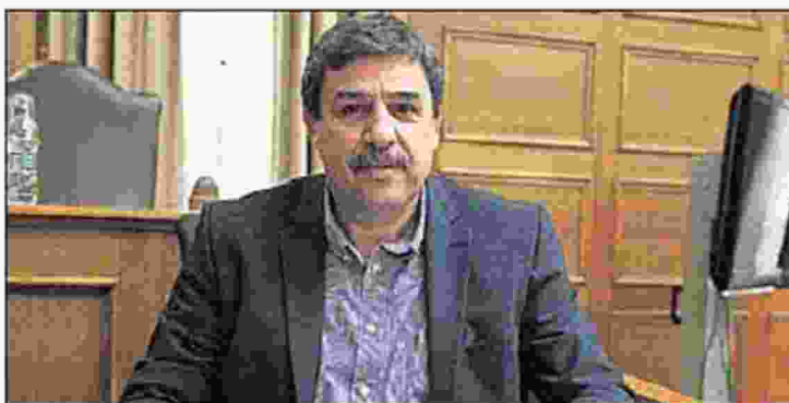
» Ανακοινώσεις έκανε ο υπουργός Υγείας Ανδρέας Ξανθός στη διάρκεια συνάντησης με αντιπροσωπεία της Ελληνικής Οδοντιατρικής Ομοσπονδίας (Ε.Ο.Ο.)

» Η Οδοντιατρική Ομοσπονδία επέμεινε κατά τη διάρκεια της συνάντησης, στις θέσεις της για υπογραφή συλλογικής σύμβασης με τον ΕΟΠΥΥ με συγκεκριμένο τιμολόγιο