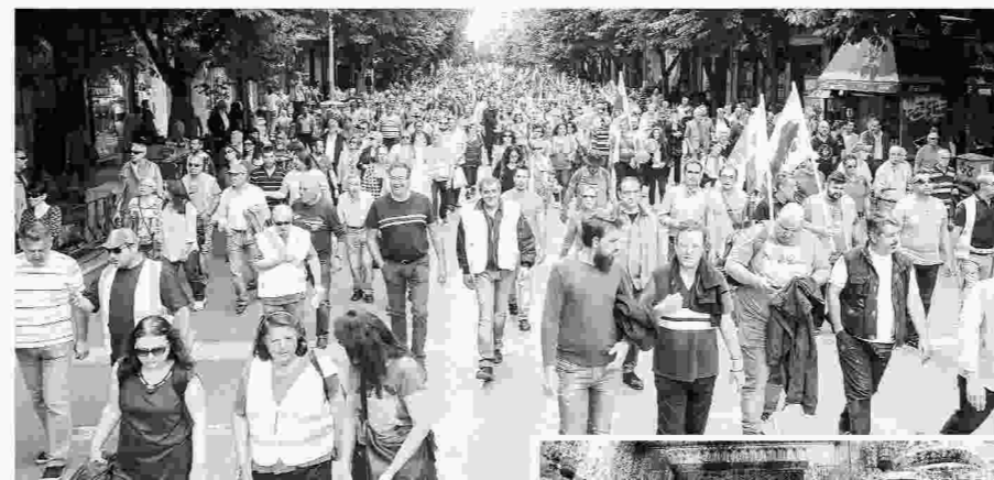
Στη Θεσσαλονίκη τη μαζικότερη πορεία διαμαρτυρίας διοργάνωσε το ΠΑΜΕ.

Στη Θεσσαλονίκη έγιναν τρεις συγκεντρώσεις, στις οποίες συμμετείχαν περίπου έξι χιλιάδες άτομα. Συγκεκριμένα, στο κάλεσμα του ΠΑΜΕ ανταποκρίθηκαν περίπου 3.500 άτομα, τα οποία πραγματοποίησαν πορεία από το άγαλμα του Βενιζέλου έως το υπουργείο Μακεδονίας - Θράκης. Στη συγκέντρωση του ΕΚΘ και της ΕΔΟΘ μπροστά από το Εργατικό Κέντρο Θεσσαλονίκης ανταποκρίθηκαν περίπου 1.500 εργαζόμενοι του ιδιωτικού και του δημόσιου τομέα. Στη συγκέντρωση συμμετείχαν μεταξύ άλλων οι εργαζόμενοι στον ΟΑΣΘ, οι οποίοι βρισκόνταν χθες στην τρίτη μέρα της επίσημης εργασίας, ενώ δικό της δυναμικό μπλοκ είχε και η Λαϊκή Ενότητα. Τέλος, μία