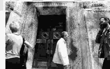
Μικρή ομάδα αγνώστων πέταξε μπιλιές στο κτίριο του Εμπορικού και Βιομηχανικού Επιμελητηρίου Θεσσαλονίκης.

τρίτη συγκέντρωση περίπου χιλίων ατόμων έγινε στην Καμάρα, με διοργανωτές την ΑΝΤΑΡΣΥΑ, τα πρωτοβάθμια σωματεία, φοιτητικούς συλλόγους καθώς και άτομα από το λεγόμενο αντιεξουσιαστικό χώρο. Και στις τρεις συγκεντρώσεις κυριάρχησαν συνθήματα και πανό εναντίον των νέων περικοπών στις συντάξεις και κατά της κυβέρνησης. Οι συγκεντρώσεις και οι πορείες έγιναν σε ήρεμο κλίμα. Εξαίρεση κάποια μικροεπεισόδια με πρωταγωνιστές άτομα του αντιεξουσιαστικού χώρου, τα οποία είχαν παρεισφρήσει στην πορεία των ατόμων που είχαν συγκεντρωθεί στην Καμάρα. Συγκεκριμένα, μικρή ομάδα αγνώστων έγραψε συνθήματα σε βιτρίνες καταστημάτων επί της οδού Τσιμισκή και στη συνέχεια πέταξε μπιλιές στο κτίριο του Εμπορικού και Βιομηχανικού Επιμελητηρίου Θεσσαλονίκης. Τέλος, μικρή ένταση προκλήθηκε όταν