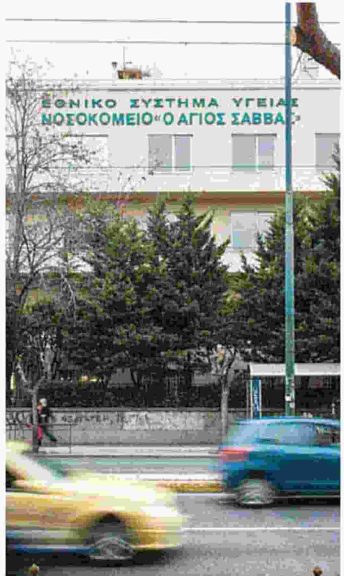
Οι διαρρήκτες στο νοσηλευτικό ίδρυμα «Άγιος Σάββας» έδρασαν ανενόχλητοι για αρκετή ώρα.