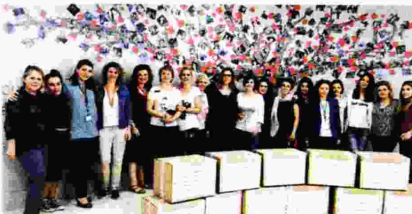
Μητέρες εργαζόμενες της Interamerican κατά την παράδοση των ειδών στα Παιδικά Χωριά SOS.

της εθελοντικής διάθεσης των ανθρώπων της Interamerican. Με αφορμή την Ημέρα της Μητέρας στις 14 Μαΐου, οι μητέρες εργαζόμενες στην εταιρεία επέλεξαν τον τρόπο της προσφοράς για να εορτάσουν την τιμητική τους. Συγκεκριμέ-