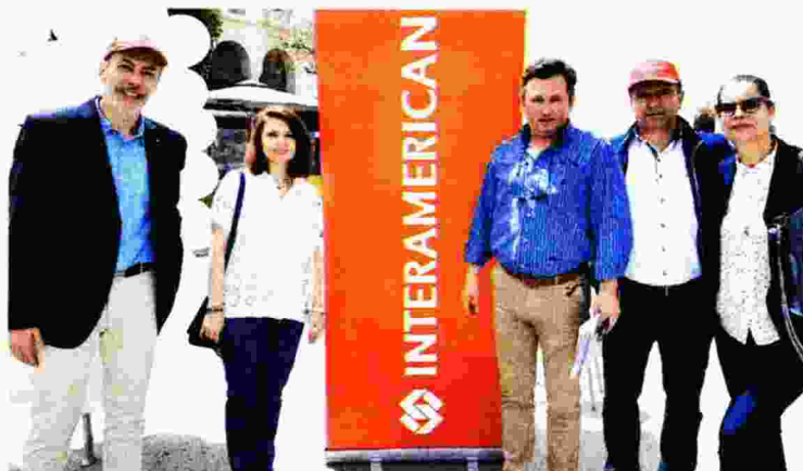
Από την καμπάνια «εμβολιάζΩ» στην πλατεία Αριστοτέλους Θεσσαλονίκης, όπου παρευρέθησαν συνεργάτες της Interamerican

Η πρόληψη και φροντίδα της υγείας, όπως τονίζεται, αποτελεί για την εταιρεία βασικό άξονα ανάπτυξης πρωτοβουλιών κοινωνικής υπευθυνότητας, στο πλαίσιο του εταιρικού σχεδίου «Πράξεις Ζωής» και σε συνάφεια με το επιχειρησιακό αντικείμενο ασφάλισης της υγείας, τομέα στον οποίο η εταιρεία δραστηριοποιείται ιδιαίτερα κατέχοντας ηγετική θέση στην ασφαλιστική αγορά.