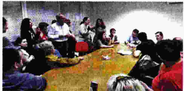
Στιγμιότυπο από τη χτεσινή παράσταση διαμαρτυρίας στα κεντρικά γραφεία του ΟΑΕΔ

Οι συγκεντρωμένοι διαμήνυσαν ότι θα κλιμακώσουν τις