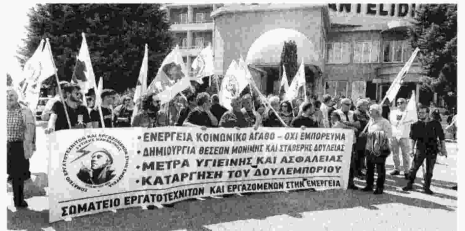
Από την κινητοποίηση του ΣΕΕΕΝ Δυτ. Μακεδονίας - ταξικό κλαδικό Συνδικάτο που αποκλείουν οι δυνάμεις του εργοδοτικού και κυβερνητικού συνδικαλισμού - την πρώτη μέρα του συνεδρίου

Οι αντιπρόσωποι της «Αγωνιστικής Συνεργασίας» κάλεσαν τους εργαζόμενους στη ΔΕΗ να γυρίσουν την πλάτη στον εργο-