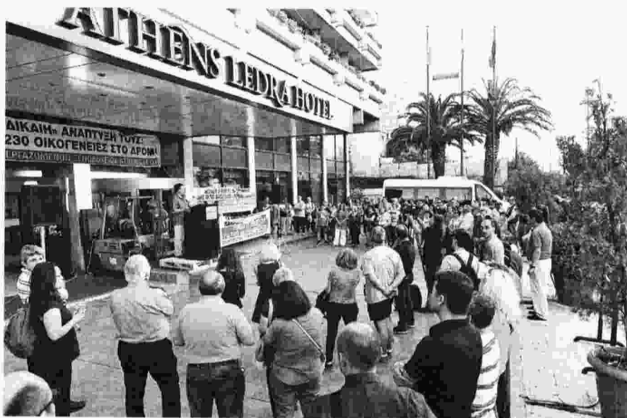
Από τη χτεσινή συγκέντρωση

Συγκέντρωση έξω από το «Athens Ledra» οργάνωσαν χτες το απόγευμα το επιχειρησιακό Σωματείο των εργαζομένων στο ξενοδοχείο και το Συνδικάτο Εργατοϋπαλλήλων Επισιτισμού - Τουρισμού - Ξενοδοχείων Αττικής. Η συγκέντρωση έγινε με αφορμή τη συμπλήρωση ενός έτους από τη μέρα που η εργοδοσία προχώρησε σε αναστολή λειτουργίας της επιχείρησης. Σήμερα, 231 εργαζόμενοι παραμένουν απλήρωτοι, με την εργοδοσία να τους οφείλει μισθούς 16 μηνών. Συνεχίζουν να διεκδικούν την καταβολή των δεδουλευμένων, τη διασφάλιση των θέσεων εργασίας και των ασφαλιστικών δικαιωμάτων, μέτρα κοινωνικής προστασίας των ιδίων και των οικογενειών τους.