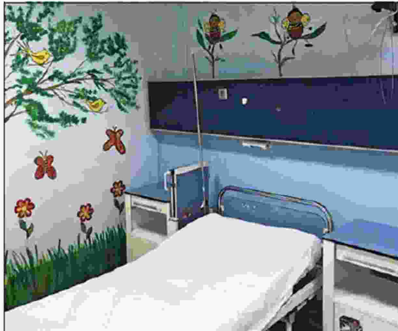
Οι εργαζόμενοι στο Καραμανδάνειο έβαψαν και ζωγράρισαν τους θαλάμους νοσηλείας