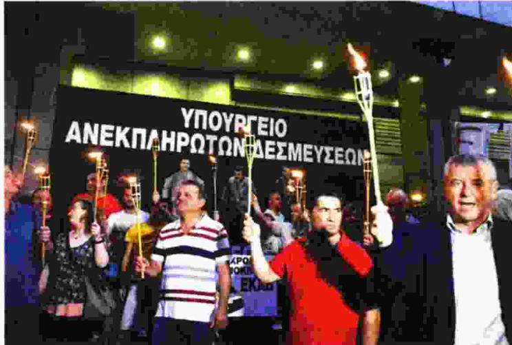
Μέλη της ΠΟΕΔΗΝ στο υπουργείο Οικονομικών