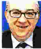
ΤΟΥ ΠΑΝΑΓΙΩΤΗ ΚΑΡΚΑΤΣΟΥΛΗ

Στην περίπτωση των σκουπιδιών, η ανακύκλωση θα είχε λύσει το πρόβλημα. Το ότι δεν λύνεται οφείλεται στην αυτοαναφορά του πολιτικού συστήματος.