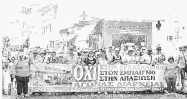
Χαρακτηριστικό στιγμιότυπο από την κινητοποίηση

«Όλοι οι πολίτες, οι αναπτυξιακοί, επιστημονικοί και αυτοδιοικητικοί φορείς της Βόρειας Ηλείας, αντιπρόθετα στο προτεινόμενο σχέδιο