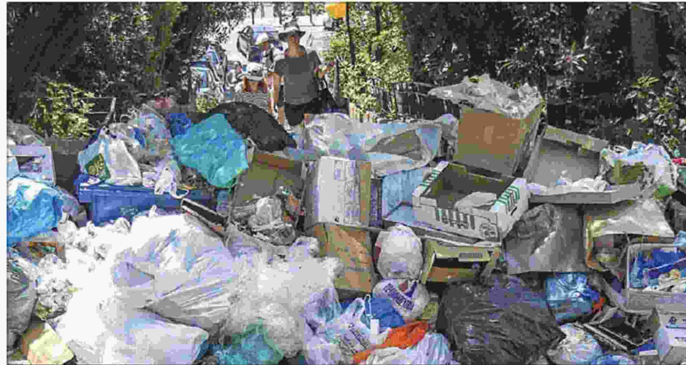
Μία από τις δραματικές εικόνες που έζησε η Ελλάδα τις τελευταίες ημέρες με τα βροντά των σκουπιδιών

Κανείς δεν μπορεί να στερεί ή να θέτει σε κίνδυνο δημόσια αγαθά (όπως αυτό της παροχής συνθηκών υγείας ή της ελεύθερης μετακίνησης ), όποια αιτήματα κι αν έχει και όσο κι αν το δίκαιο είναι (αν είναι) με το