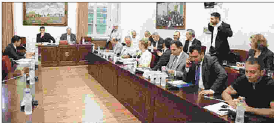
Από τη χθεσινή συνεδρίαση της Εξεταστικής για την Υγεία.