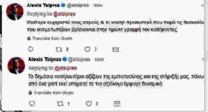
Τα tweets του πρωθυπουργού με τις ευχαριστίες του