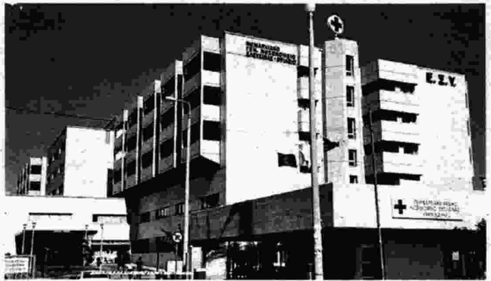
Το Θριάσιο Νοσοκομείο

Σχετικά με τη δήλωση της διοίκησης του νοσοκομείου ότι σκοπεύ-