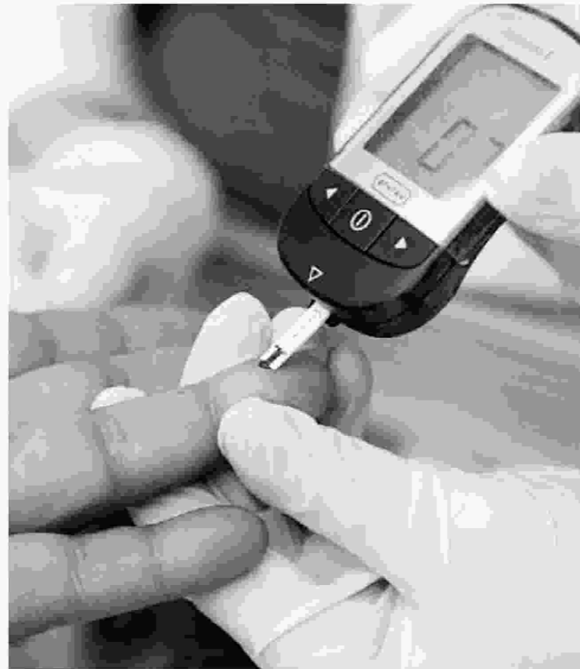
Χωρίς προϊόντα για σακχαρώδη διαβήτη, για ειδική διατροφή και ορθοπεδικές/ αναπνευστικές συσκευές κινδυνεύουν να μείνουν οι ασφαλισμένοι.

Μάλιστα, συμπληρώνει χαρακτηριστικά ότι οι φαρμακοποιοί της Θεσσαλονίκης είναι απλήρωτοι για τα υλικά αυτά, τα οποία χορήγησαν από την αρχή του έτους και έχουν εξαντληθεί όλα τα αποθέματα