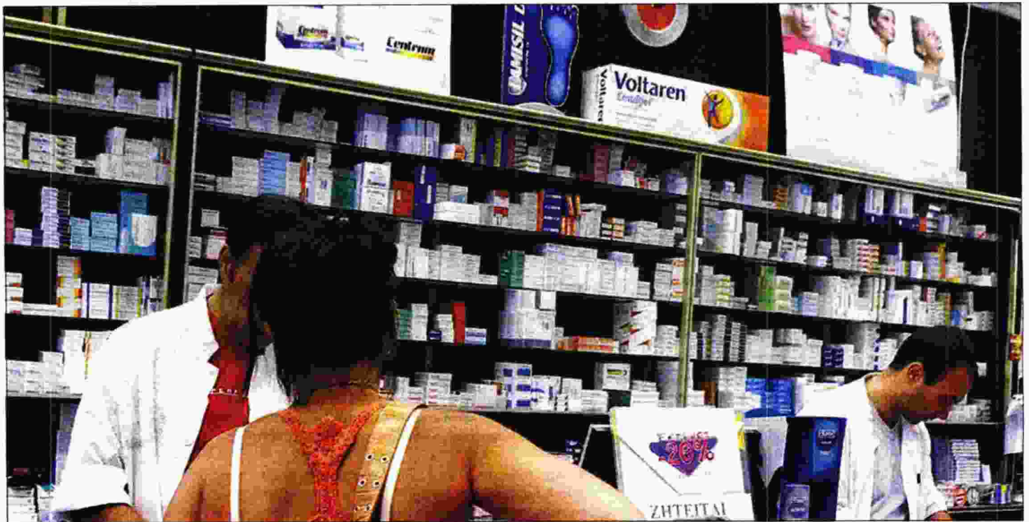
Οι φαρμακοποιοί χτυπάνε καμπανάκι γιατί πολύ σύντομα δεν θα μπορούν να εκτελέσουν συνταγές και παραπεμπτικά

Χ ωρίς τα απαραίτητα για την υγεία τους αναλώσιμα για τον σακχαρώδη διαβήτη, σκευάσματα ειδικής διατροφής, ορθοπεδικές και αναπνευστικές συσκευές κινδυνεύουν να βρεθούν οι ασφαλισμένοι του ΕΟΠΥΥ, εξαιτίας των προβλημάτων που αντιμετωπίζουν τα φαρμακεία λόγω των διαδικασιών ελέγχου και πληρωμής των παραπεμπικών από τον ΕΟΠΥΥ για τα συγκεκριμένα προϊόντα. Οπως καταγγέλλει ο Φαρμακευτικός Σύλλογος Θεσσαλονίκης (ΦΣΘ), παρά τις τελευταίες προσπάθειες και τις συναντήσεις μεταξύ των εκπροσώπων των κλάδου και του προέδρου του ΕΟΠΥΥ για να βρεθεί μία λύση, οι δυσκολίες παραμένουν, ενώ χαρακτηρίζει την ανακοίνωση κάποιων παρεμβάσεων εκ μέρους του οργανισμού «μέτρα-ασπιρίνη».