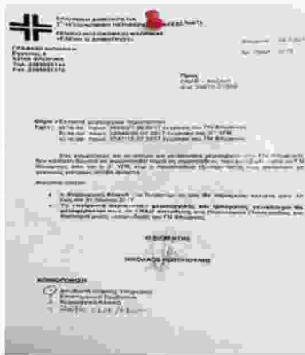
Το έγγραφο του διοικητή του Νοσοκομείου σύμφωνα με το οποίο η κλινική θα μείνει κλειστή από 18 έως 31 Ιουλίου.