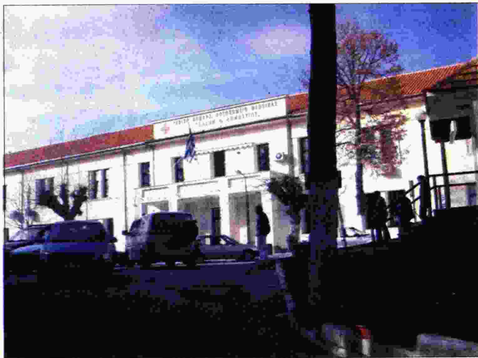
Σύμφωνα με την ΠΟΕΔΗΝ, το νοσοκομείο εφημερεύει κάθε μέρα, 24 ώρες το 24ωρο

Εξάλλου, λίγες μέρες πριν η ΠΟΕΔΗΝ, με ανακοίνωσή της, κατήγγειλε σοβαρά προβλήματα, τα οποία έχουν ως αποτέλεσμα την επισφαλή λειτουργία του νοσοκομείου στη Φλώρινα. Στην ανακοίνωση αυτή επισημαίνεται, μεταξύ άλλων, ότι το νοσοκομείο εφημερεύει κάθε μέρα, 24 ώρες το 24ωρο, ενώ έχει μεγάλες ελ-