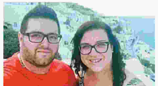
Νιόπαντρο ζευγάρι ήρθε στη Σαντορίνη και ατύχησε: ο σύζυγος αρρώστησε και θα πέθαινε αν δεν του έκαναν δεύτερο χειρουργείο