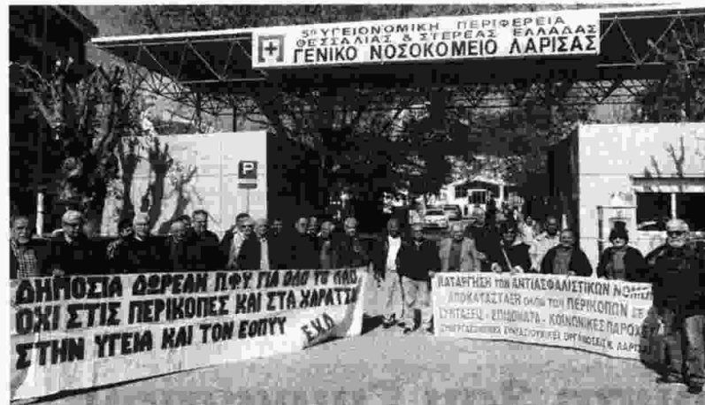
Από κινητοποίηση του Εργατικού Κέντρου και σωματείων της Λάρισα για την Υγεία τον περασμένο Απρίλη

- Σημαντικές είναι οι ελλείψεις και τα προβλήματα λειτουργίας του τεχνολογικού εξοπλισμού και στα δυο νοσοκομεία (π.χ. ακτινοθεραπευτικά μηχανήματα, με αποτέλεσμα να αναβάλλονται θεραπείες και να σπρώχνονται καρκινοπαθείς και άλλοι ασθενείς σε νοσοκομεία της Θεσσαλονίκης και της Αθήνας ή σε ιδιωτικά θεραπευτήρια), λείπουν καρδιογράφοι, ΧΟΛΝΤΕΡ, ενώ συχνά είναι χαλασμένα τα μηχανήμα-