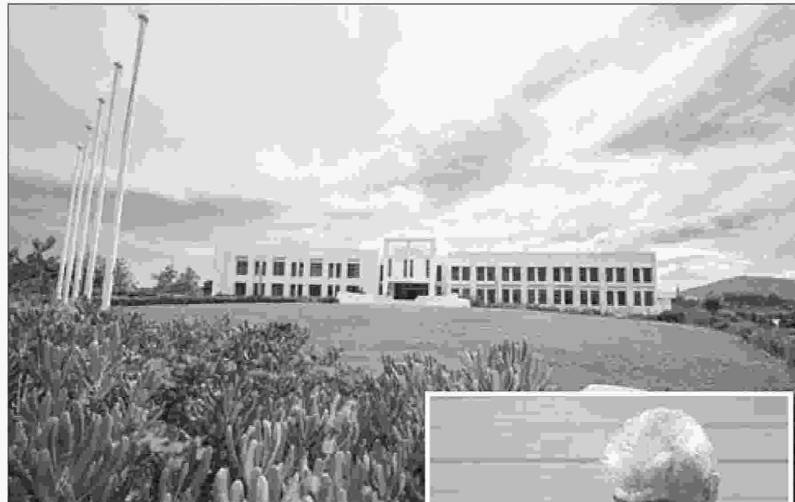
Κέντρο Εξατομικευμένης Ιατρικής θα λειτουργήσει στο ΙΤΕ

Προκειμένου να αρχίσει η λειτουργία του Κέντρου, απαιτούνται περίπου 5 εκ ευρώ που θα καλυφθούν από ανταγωνιστικά προγράμματα, εθνικά και διεθνή, και από κονδύλια που θα εξασφαλίσει το ΙΤΕ μέσω χορηγιών ή άλλων πηγών. Αυτή τη στιγμή έχει εξασφαλιστεί ένα μεγάλο μέρος του παραπάνω ποσού, ενώ η