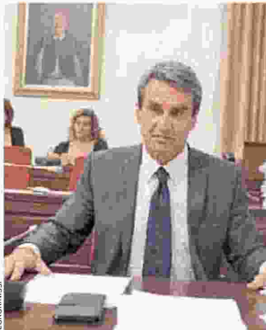
Για δεύτερη φορά κατέθεσε ως μάρτυρας χθες ο κ. Λοβέρδος.