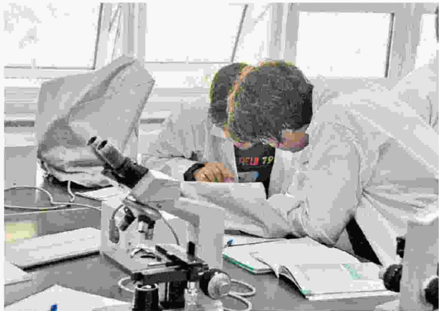
Η απουσία επαγγελματικής προοπτικής αποτρέπει τους νέους γιατρούς από την ιατροδικαστική.

Προσλήψεις μόνιμων ιατροδικαστών στο ΕΣΥ δεν έχουν γίνει εδώ και τουλάχιστον μία δεκαετία.