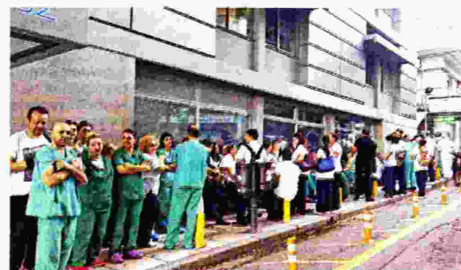
Από κινητοποιήσεις σε Αθήνα και Θεσσαλονίκη ενάντια στην απλήρωτη δουλειά και τις απολύσεις

τον ανταγωνισμό με τους ομίλους, κυρίως μετά το ξέσπασμα της οικονομικής κρίσης, αλλά απλήρωτη εργασία υπάρχει και στους μεγάλους ομίλους», μας λέει ο Ν. Παρδάλης.