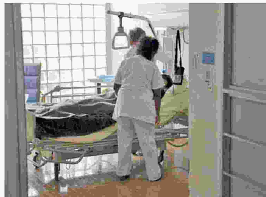
Στην Ελλάδα λειτουργούν πάνω από 35 Μονάδες Ημερήσιας Νοσηλείας.

Άμεση ήταν η αντίδραση της Πανελλήνιας Ένωσης Μονάδων Ημερήσιας Νοσηλείας, η οποία κάνει λόγο για «επιλεκτική, τιμωρητική και ύποπτη αντιμετώπιση» των ΜΗΝ έναντι των κλινικών από την πολιτεία. Όπως αναφέρει η Ένωση, δίνεται μόλις ένα έτος διορία στις ΜΗΝ να συμμορφωθούν στα νέα δεδομένα, όταν σε αντίστοιχη περίπτωση οι κλινικές είχαν 20 χρόνια περιθώριο. Σύμφωνα με την Ένωση, σήμερα λειτουργούν περισσότερες από 35 ΜΗΝ που έχουν επενδύσει άνω των 210 εκατ. ευρώ, ενώ ταυτόχρονα έχουν βοηθήσει το Δημόσιο να εξοικονομήσει εκατομμύρια ευρώ. «Μόνο οι οφθαλμολογικές ΜΗΝ στα τέσσερα χρόνια λειτουργίας τους έχουν πραγματοποιήσει πάνω από 30.000 επεμβάσεις καταρράκτη και 5.000 υαλοειδεκτο-