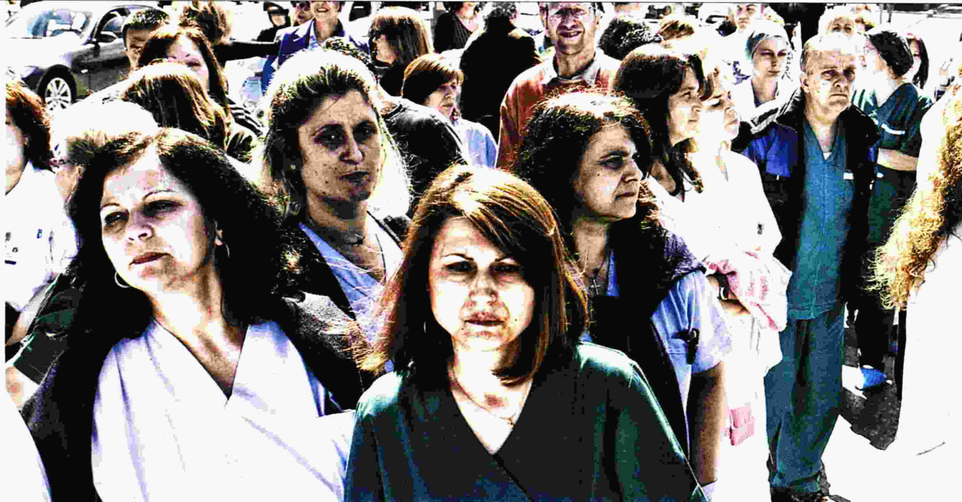
Μέλη της ΠΟΕ-ΔΗΝ σε παλαιότερη συγκέντρωση έξω από το νοσοκομείο Ιπποκράτειο της Θεσσαλονίκης