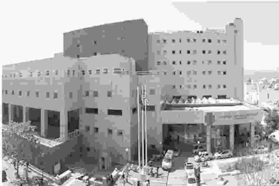
"Οι συνεχείς ελλείψεις ιατρικού και νοσηλευτικού προσωπικού πολλών κλινικών και μονάδων του Νοσοκομείου, έχουν ως αποτέλεσμα την υπολειτουργία αυτών", επισημαίνεται μεταξύ άλλων στην ερώτηση των βουλευτών για το Νοσοκομείο

- Η Γαστρεντερολογική κλινική απουσιάζει του καθημερινού προγράμματος εφημερίας, καθώς ήδη από τριετίας, δεν στελεχώνεται από κανέναν μόνιμο ιατρό, παρά μόνο από έναν επικουρικό. - Η Παιδιατρική κλινική έχει μόνο έναν μόνιμο ιατρό και για