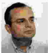
Του ΣΤΑΥΡΟΥ ΔΗΜΟΠΟΥΛΟΥ

ΓΙΑΤΡΟΙ είναι αυτοί που δίνουν φάρμακα, για τα οποία ξέρουν λίγα, για να γιατρέψουν αρρώστιες, για τις οποίες ξέρουν λιγότερα, σε ασθενείς για τους οποίους δεν ξέρουν τίποτα, είχε πει ο Βολταίρος.