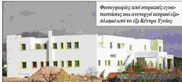
Φωτογραφίες από κτιριακές εγκαταστάσεις και ανενεργό ιατρικό εξοπλισμό από τα έξι Κέντρα Υγείας

Ακόμη, στη ίδια λίστα είναι και το Κ.Υ. στο Λεβίδι Αρκαδίας, όπως καταγγέλλει η ΠΟΕΔΗΝ, το οποίο στεγάζεται στο επισκευασμένο γυμνάσιο και стоίχισε 75.000.000 ευρώ. Ωστόσο, ποτέ δεν λεπούργησε εκεί.