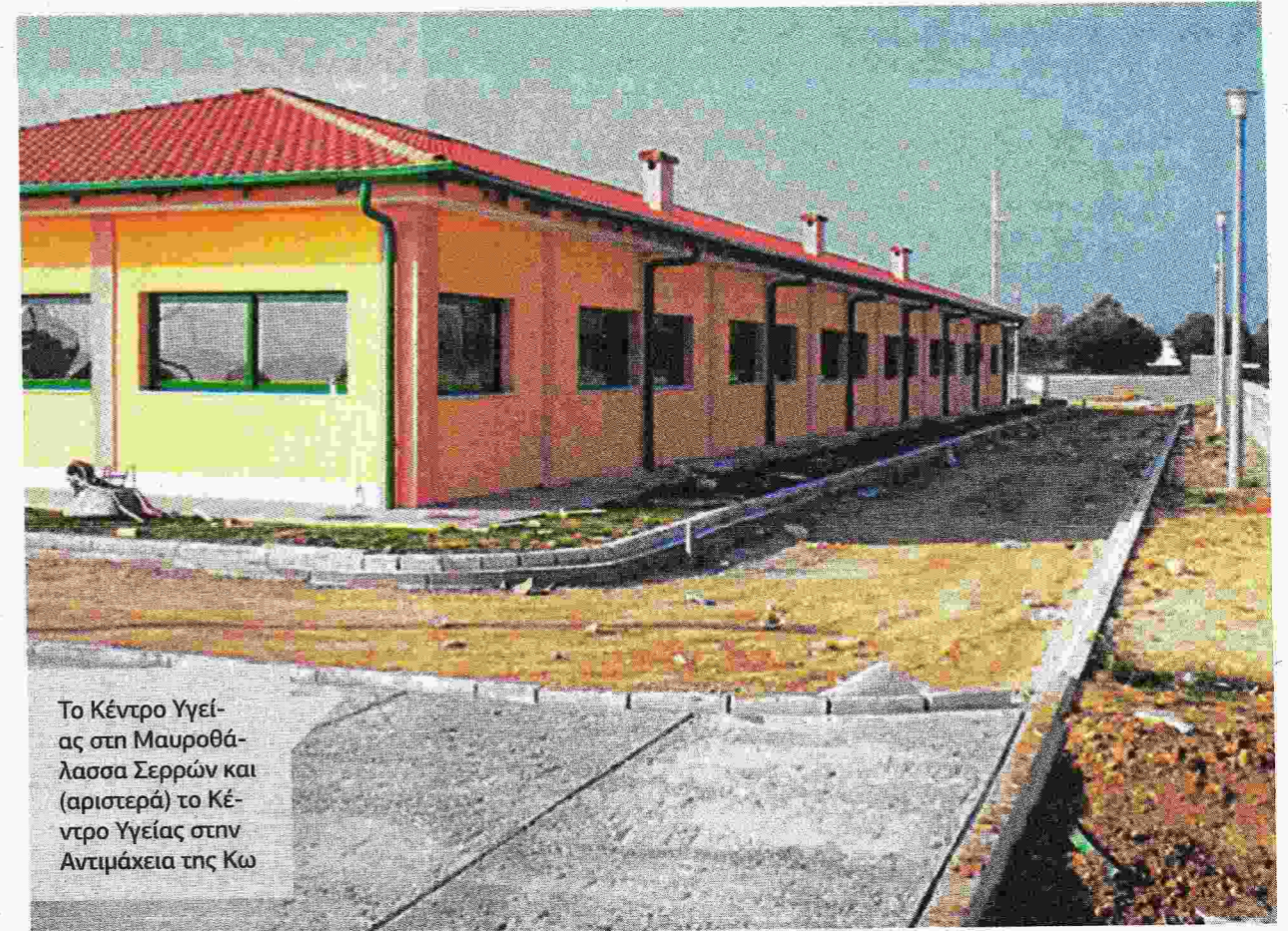
Το Κέντρο Υγείας στη Μαυροθάλασσα Σερρών και (αριστερά) το Κέντρο Υγείας στην Αντιμάχεια της Κω