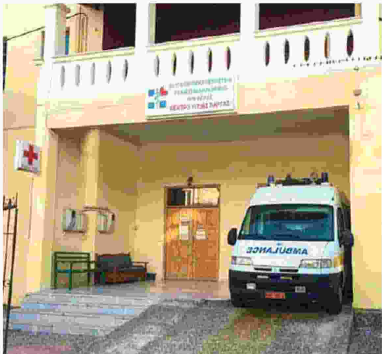
Τέσσερις η ώρα το μεσημέρι, το Ιατρικό Κέντρο της Πάργας κατεβάζει ρολά.