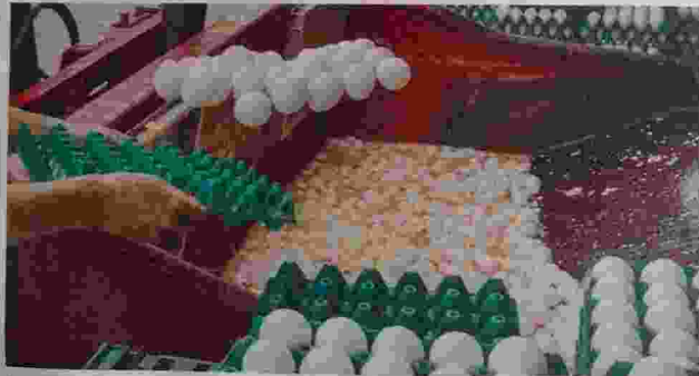
Μολυσμένα γόνατα της Ευρωπαϊκής Ένωσης καθώς και η Ελβετία και το Χονγκ Κονγκ, ήταν μέχρι στιγμής πάτημα από την κρίση των μολυσμένων αυγών. ΣΕΛ 8-9