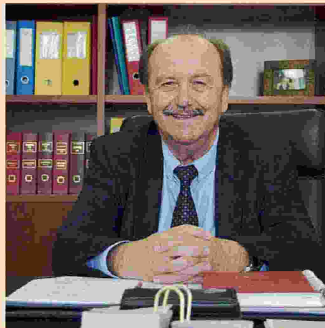
Σε τρία υποκαταστήματα του πρώην ΙΚΑ που ελέγχθηκαν, Αιγάλεω, Πάτρα και Βόλος, η ζημιά ξεπερνά το 1 εκατ. ευρώ και στα 2 από αυτά ο έλεγχος θα συνεχιστεί, λέει ο διοικητής του ΕΦΚΑ Θανάσης Μπακαλέξης.

– Βεβαίως, αντιμετώπισαμε προβλήματα. Συνοπτικά, σας λέω ότι έπρεπε να δημιουργούμε τον νέο