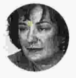
Μαριέττα Γιαννάκου Πρώην υπουργός Παιδείας

Ο νόμος 3577/2007 περιλάμβανε ειδικό άρθρο για τα ιδιωτικά ΤΕΕ. Προ αυτού, με βάση καταγγελίες που είχαν γίνει από την ΟΙΕΛΕ και είχαν επιβεβαιωθεί, είχαν επιβληθεί πειθαρχικές κυρώσεις ανάλογης βαρύτητας με το αδίκημα για όλες τις παραβάσεις των κανόνων λειτουργίας και για τα σχολικά έτη 2004-2008. Ο νόμος όριζε ότι οι μαθητές αυτών των ΤΕΕ θα λάμβαναν έγκυρο πτυχίο ύστερα από ειδικές πτυχιακές εξετάσεις που θα διενεργούσε το υπουργείο Παιδείας. Το ουσιαστικό πρόβλημα είναι ότι