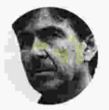
Δημήτρης Μπαξεβανάκης Υπουργός Παιδείας

Το 2007 επί υπουργίας της κ. Γιαννάκου ψηφίστηκε ο νόμος 3577 που όριζε τη διενέργεια πτυχιακών εξετάσεων για τους κατόχους χιλιάδων παράτυπων πτυχίων που εκδόθηκαν από αρκετά ιδιωτικά ΤΕΕ των οποίων η λειτουργία κρίθηκε μη νόμιμη και στα οποία επιβλήθηκαν ποινές. Οι εξετάσεις αυτές δεν πραγματοποιήθηκαν ποτέ ούτε από την κυβέρνηση της ΝΔ ούτε από την επόμενη κυβέρνηση του ΠΑΣΟΚ ούτε από τη συγκυβέρνηση Σαμαρά - Βενιζέλου. Στην τελευταία μάλιστα κυβέρνηση υπουργός Διοικητικής Μεταρρύθμισης ήταν ο Κυριάκος Μητσοτάκης , ο οποίος παριστάνει ότι θέλει δάσκειν να ενισχύσει την αριστεία. Ενώ λοιπόν πρόλαβε να θέ-