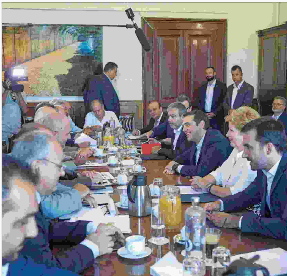
Ο Αλ. Τσίπρας με τους εκπροσώπους των παραγωγικών φορέων της Θεσσαλονίκης

Ταυτόχρονα, χαρακτήρισε κρίσιμη την τρέχουσα χρονιά, ενώ αναφέρθηκε και στους στόχους της ελληνικής κυβέρνησης για την επόμενη ημέρα, μετά την έξοδο από την αυστηρή επιτροπεία. Χαρακτήρισε σπ-