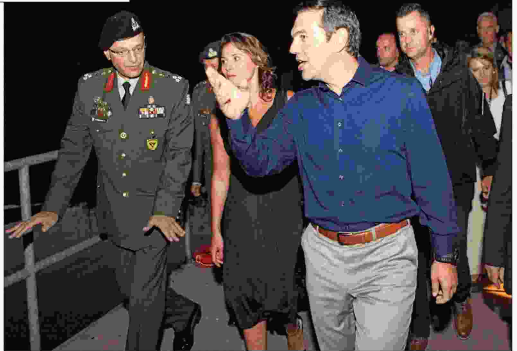
Ο Αλ. Τσίπρας συνοδευόμενος από την Περιστέρα Μπαζιάνα στη Φλώρινα

Χθες ο Αλέξης Τσίπρας επισκέφτηκε το χωριό Άγιος