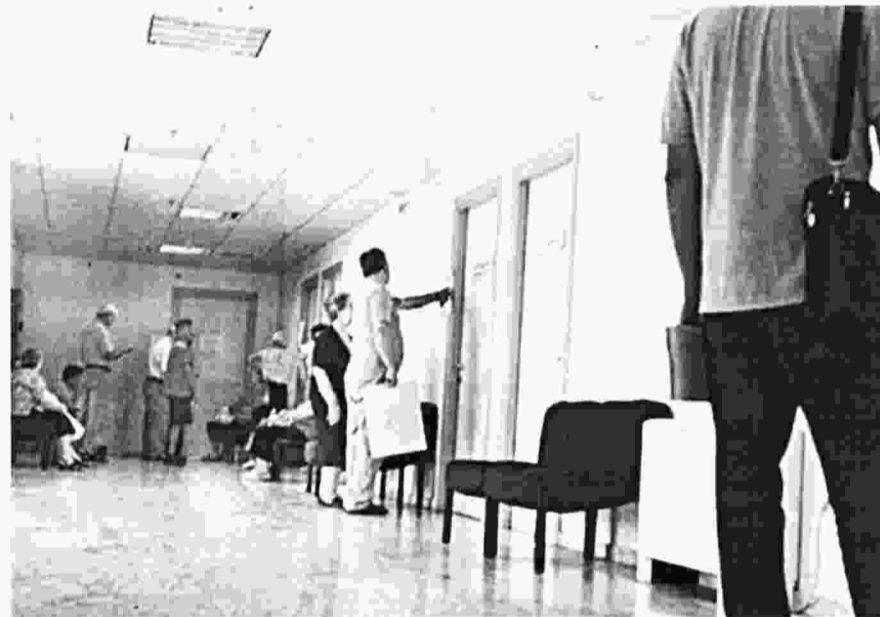
Έλλειψη γιατρών, το δρομολογούμενο σύστημα των ΤΟΜΥ δεν μπορεί να λειτουργήσει