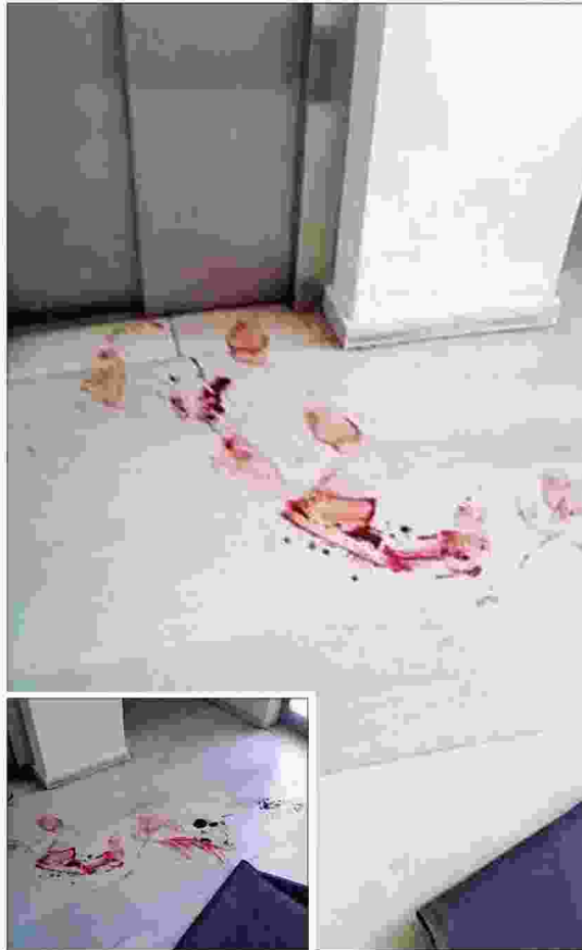
Αίμα από τα τραύματα του δημάρχου Ελευσίνας Γιώργου Τσουκαλά (δεξιά) καθώς μεταφερόταν από το γραφείο του στο Θριάσιο Νοσοκομείο

Ο δήμαρχος Ελευσίνας, με δύο τραύματα στη γάμπα, μεταφέρθηκε για τις πρώτες