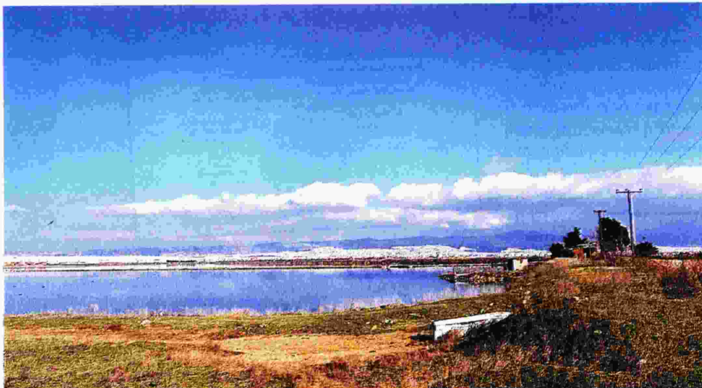
Από την κατάσταση που έχει διαμορφωθεί κινδυνεύει η προστατευόμενη περιοχή της λιμνοθάλασσας Καλοχωρίου και η συζήτηση στο χθεσινό περιφερειακό συμβούλιο κινήθηκε γύρω από τους ελέγχους που θα έπρεπε να γίνουν και τα πρόστιμα που πρέπει να επιβληθούν στους εμπλεκόμενους.