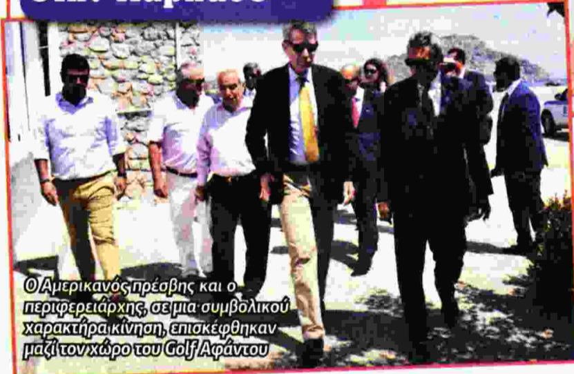
Ο Αμερικανός πρέσβης και ο περιφερειάρχης, σε μια συμβολικού χαρακτήρα κίνηση, επισκέφθηκαν μαζί τον χώρο του Golf Αφάντου