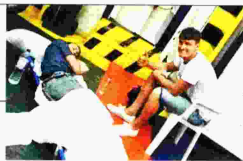
Σε ένα φορείο στο γκαράζ του πλοίου, συνοδευόμενος μόνο από κάποιον φίλο του, ταξίδεψε για τα Ιωάννινα ο Βρετανός τουρίστας...

Οι ελλείψεις σε ιατρικό και νοσηλευτικό προσωπικό έχουν προκαλέσει «έμφραγμα» στα δημόσια νοσοκομεία