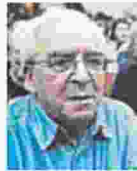
ΤΟΥ ΚΛΕΑΡΧΟΥ ΤΣΑΟΥΣΙΔΗ

Φτάσαμε και σ' αυτό: νοσηλευτές του Θεαγένειου νοσοκομείου Θεσσαλονίκης, του μοναδικού αντικαρκινικού ιδρύματος στη Βόρεια Ελλάδα, απεργούν (στάση εργασίας είναι επίσημα) στις 8 Σεπτεμβρίου στο πλαίσιο της «πανελλαδικής κινητοποίησης της ΠΟΕΔΗΝ» και ζητούν από τους διευθυντές των κλινικών να μην υπάρχουν ραντεβού για χημειοθεραπείες αυτήν την ημέρα.