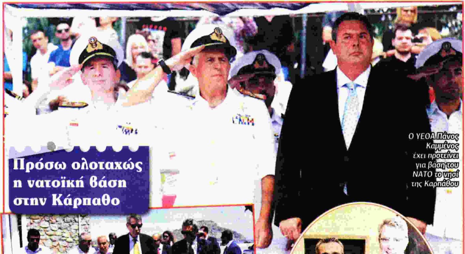
Ο ΥΕΘΑ Πάνος Καμμένος έχει προτείνει για βάση του ΝΑΤΟ το νησί της Καρπάθου

Την ίδια ώρα, τραγικά είναι τα κενά στο χώρο των δημόσιων νοσοκομείων, με ελλείψεις γιατρών και νοσηλευτών, που η κυβέρνηση δεν μπορεί να αντιμετωπίσει. Ωστόσο, σύμφωνα με καταγγελία της ΠΟΕΔΗΝ, κατασκευάζεται νέο νοσοκομείο στην Κάρπαθο, με τους ιθύνοντες να αποφιλιώνουν το νοσοκομείο του Διδυμοτεί-