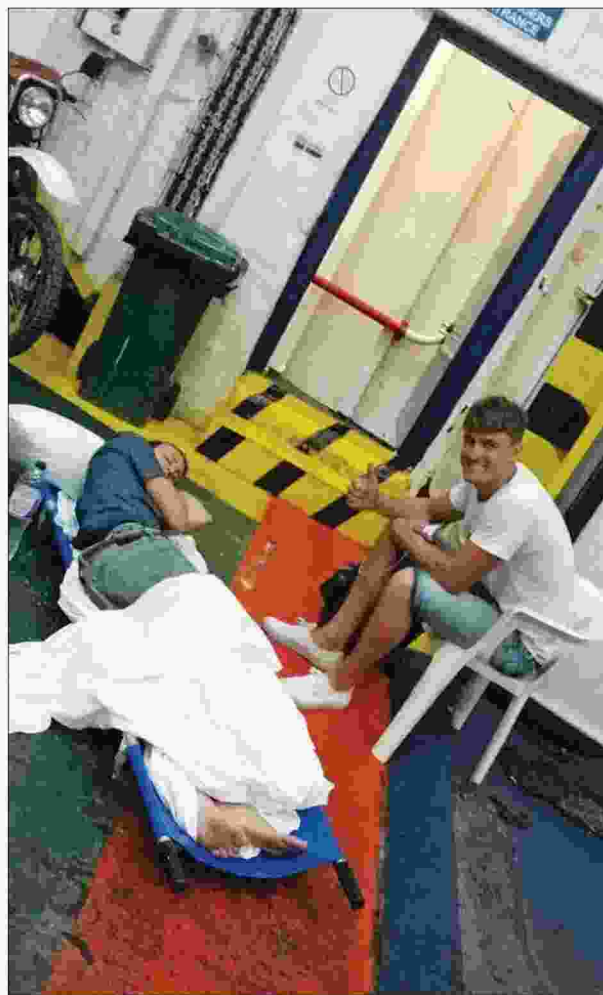
Ο τραυματίας πάνω στο φορείο με μόνη συνοδεία έναν φίλο του στο γκαράζ του πλοίου

ται αεροδιακομιδές. Φαίνεται να διακομίζονται ασθενείς με έμφραγμα και το ασθενοφόρο να περιμένει στην ουρά για να πληρώσει διόδια!» είπε στη «δημοκρατία» ο αντιπρόεδρος του ΕΚΑΒ Μιλτιάδης Μυλωνάς, ξεκαθαρίζοντας ταυτόχρονα ότι στη συγκεκριμένη περίπτωση ήταν ασθενοφόρο του ΚΥ