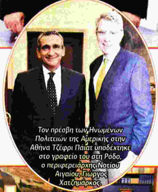
Τον πρέσβη των Ηνωμένων Πολιτειών της Αμερικής στην Αθήνα Τζέφρι Ράιτ υποδέχτηκε στο γραφείο του στη Ρόδο, ο περιφερειάρχης Νοτίου Αιγαίου, Γιώργος Χατζημάρκος.

κου από γιατρούς και νοσηλευτές (προφανώς για να τους ...μετακομίσει στο νησί). Η ΠΟΕΔΗΝ σε ανακοίνωσή της αναφέρει ότι το νοσοκομείο Καρπάθου κατασκευάζεται, γιατί ο υπουργός Άμυνας Πάνος Καμμένος και η κυβέρνηση «ετοιμάζονται για την μεταφορά της νατοϊκής βάσης της Σούδας, στην Κάρπαθο και οι Αμερικανοί θέλουν νοσοκομείο. Δεν παίζουν με την υγεία των στρατιωτών τους. Ο κ. Καμμένος είπε στους Αμερικανούς ότι η Κάρπαθος είναι έτοιμη να υποδεχθεί τη βάση και μάλιστα με νέο Νοσοκομείο». Μάλιστα την κατασκευή του νοσοκομείου την επιβεβαιώνει και ο δήμαρχος Καρπάθου, Ηλίας Λάμπρος, ο οποίος έχει δηλώσει ότι το νοσοκομείο θα διαθέτει 22 κλίνες και υπολογίζει ότι ως το τέλος του χρόνου θα έχει ολοκληρωθεί το κτίριο και αναμένεται να δουν μετά, το πόσο γρήγορα θα προχωρήσει το οργανόγραμμα για τη στελέωσή του νοσοκομείου. Το ερώτημα είναι οι 22 κλίνες θα είναι για πολίτες ή γιαγιάνκηδες πεζοναύτες; Μάλλον, το δεύτερο.