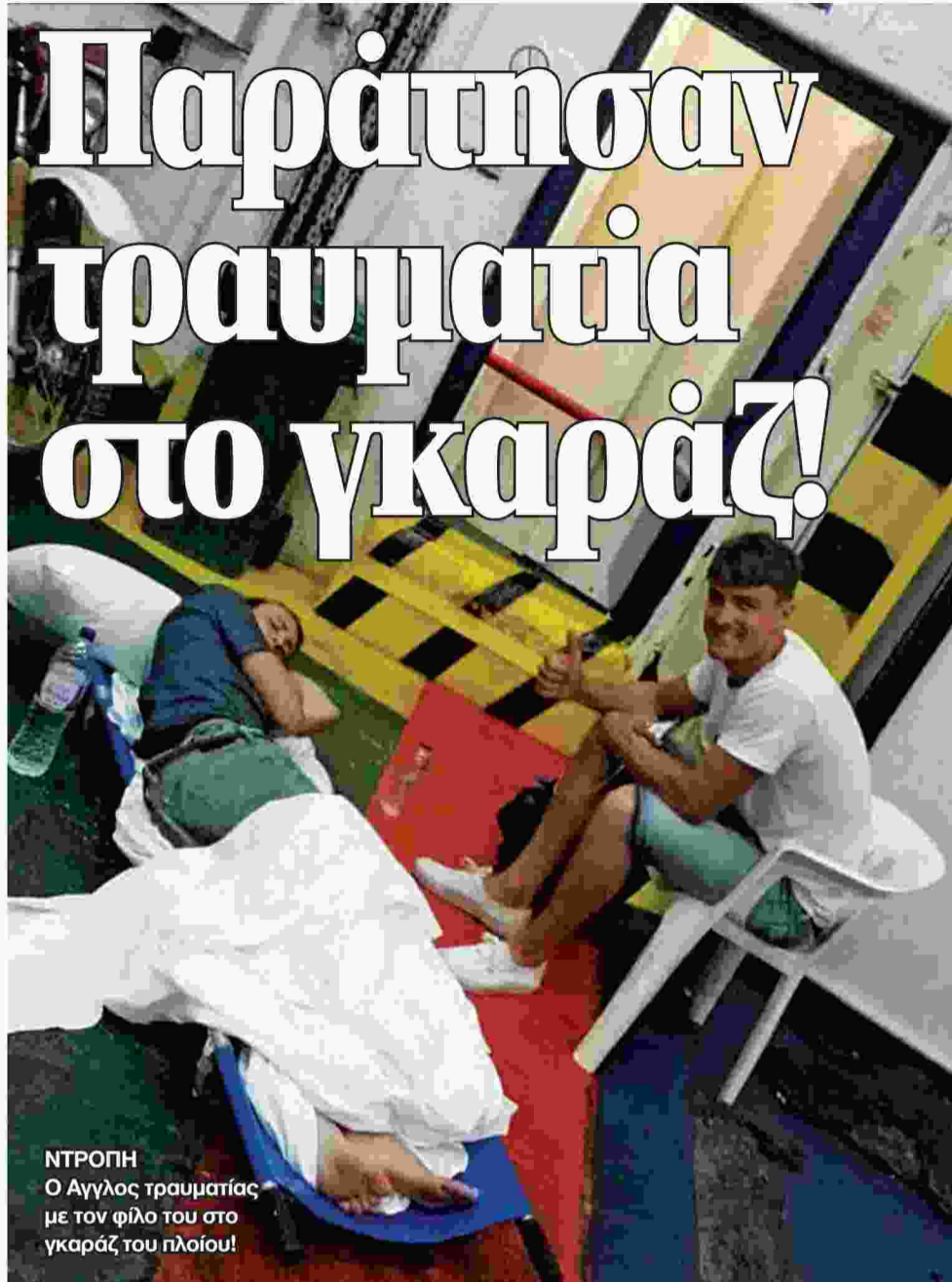
ΝΤΡΟΠΗ Ο Άγγλος τραυματίας με τον φίλο του στο γκαραζ του πλοίου!