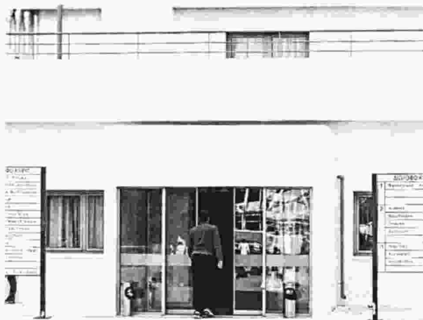
Το νοσοκομείο ερευνά το περιστατικό. Χθες δεν πήρε θέση