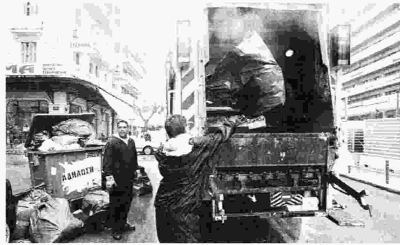
Πίσω από απορριμματοφόρο, σε μια δουλειά επώδυνη και επικίνδυνη για το γυναικείο οργανισμό, έχασε τη ζωή της η 30χρονη συμβασιούχος στην Ηλεία

Χτες, στην Ηλεία , σημειώθηκε το πέμπτο θανατηφόρο εργατικό «ατύχημα» σε δήμο τους τελευταίους δύο μήνες. 30χρονη συμβασιούχος εργαζόμενη στην υπηρεσία καθαριότητας στο δήμο Πύργου, μητέρα δύο παιδιών, βρισκόταν στο πίσω μέρος απορριμματοφόρου, την ώρα που αυτό έκανε όπισθεν και την παρέσυρε, με αποτέλεσμα το βαρύ τραυματισμό της. Αφού επενέβη η Πυροσβεστική Υπηρεσία για τον απεγκλωβισμό