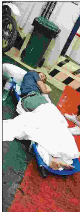
Ο Βρετανός τραυματίας πάνω σε φορείο, στο γκαράζ του πλοίου προς Ηγουμενίτσα